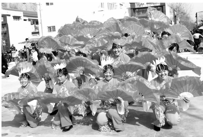
河南省非物质文化遗产“莲花灯舞”