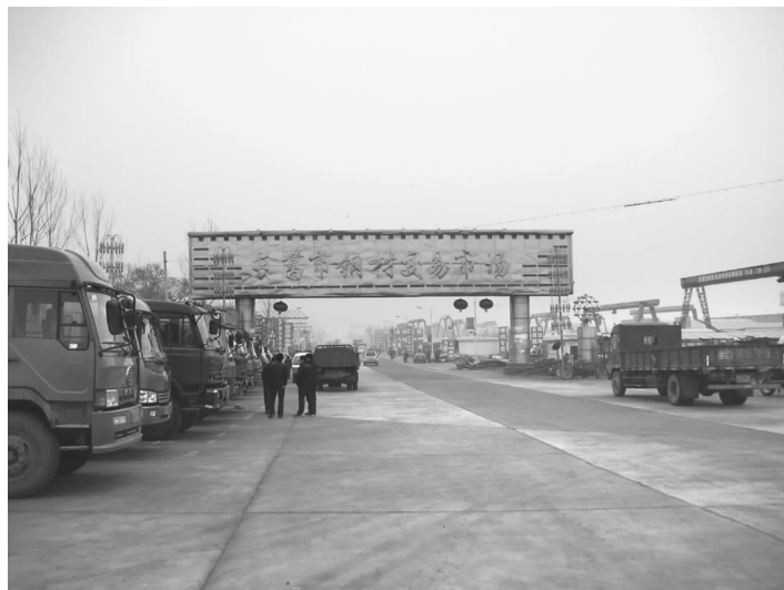
长葛钢材交易市场

1993年和尚桥镇依托区位优势，抓住机动三轮车行业快速发展的机遇，投资1300万元，