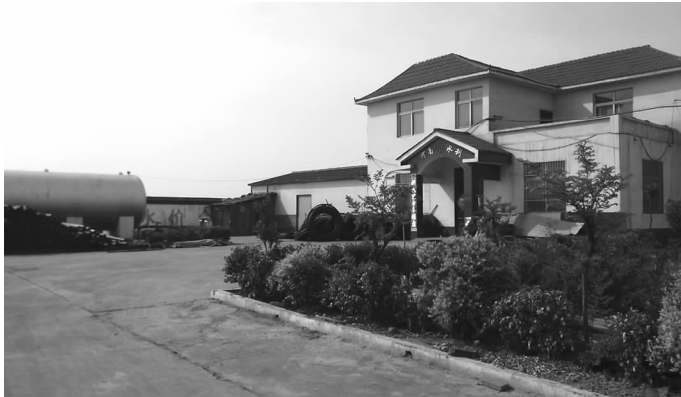
坡胡饮水工程西刘水厂

清初，外地饥民逃荒至此定居，后因村中刘姓有一郡马，故名刘村。刘村含西刘、中刘、东刘三个村，后西刘、中刘合为一个村统称西刘。村原有留村寺。