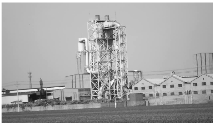
恒源木业有限公司

1980年后，企业发展迅猛，成为全镇的重要经济支柱，逐步形成工业、种养业、建筑业、交通运输业、商贸业和餐饮服务业等20多个行业和一村一品格局。2000年前，工业以农机配件加工为主，兼有铸造、化工、造纸、人造板材、食品加工、纺织厂等。营张兴华化工厂生产的活