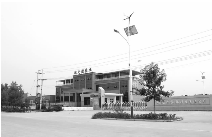
河南瑞之源农业科技有限公司

砌大口井提水灌溉。1957年，石固公社按照中共中央、国务院有关兴修水利的决定要求，投入劳动力12000多人，大干一冬一春，共挖坑塘21个，打井31眼。1978年底和1979年初，根据长葛县委制定的水利建设规划，掀起了治理“三河三岗（石梁河、小洪河、暖泉河、曹岗岗、谷马岗、岗河岗）”的水利建设高潮，并在石梁河石固大桥西修建一座蓄水桥闸。改革开放后，石固镇不断加大对农田水利基础设施建设的投入，通过科学规划和大力实