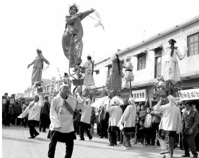
民间文化艺术活动之肘阁

肘阁原名叫抬阁。最先是由四个人直接抬一张桌子，让表演人员站在桌子上面表演。后来发展到用两根木棍绑在桌子上，像抬花轿一样由四个人抬着桌子让表演人员在上面表演。表演人员通常化装打扮成戏剧、神话中的人物，采用说唱与动作相结合的艺术形式进行表演。为了使演出节目更精彩动人，表演者经过长期实践创造出了不抬着表演，而是肘起来表演的方式。“抬阁”也就由此改名。