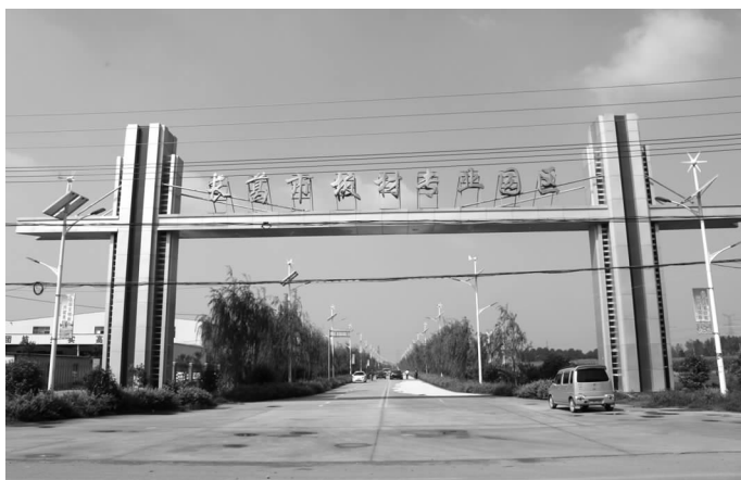
长葛市板材专业园区

河南诚德木业有限公司位于石固镇板材工业园区内，始建于 2004 年，占地面积 65366 平方米，建筑面积 28680 平方米，员工 185 人。公司有两条中高密度纤维板生产线，第一条层压生产线于 2005 年投产，总投资 2300 万元，第二条连续辊压生产线于 2008 年投资 5200 万元建设，年生产能力 10 万立方米。主导产品为 1220 × 2440 × 2 ~ 8mm 中高密度纤维板。产品主要用于高档板式家具、各类装修、工艺品包装和门板、门套材料。产品主要销往