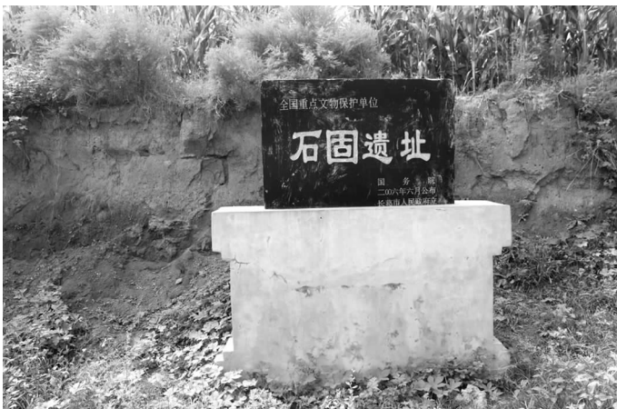
全国重点文物保护单位——石固遗址

文化底蕴丰厚。石固境内有国家级重点文物保护单位——裴李岗文化和仰韶文化共存的石固遗址，相传为葛天氏之墟；有省级文物保护单位——建“观”于宋、改“宫”于元的“天宝宫”，宫内存有大元皇帝白话圣旨碑，大元皇帝宣谕圣旨蒙汉文合璧圣旨碑，属国内罕见文物；有“班固坟”遗址，是纂修历史巨著《汉书》的东汉著名史学家班固隐居、卒葬之地，石固之“固”名源于此；有县级文物保护单位“白乐宫”，是唐代诗人白居易隐居及墓祠之所；有清“石梁县县衙”旧址，见证石固为周边地区经济、政治、文化中心；有“山西会馆”和“山西当铺”旧址，足见石固当年商贸之活跃；有 1925 年“中共石固南寨党支部”旧址，是许昌市第一个中共支部诞生之地。石固有许多世代传承、不断发展的民间艺术社团，群众文化生活丰富多彩，被命名为“中国民间艺术之乡”。