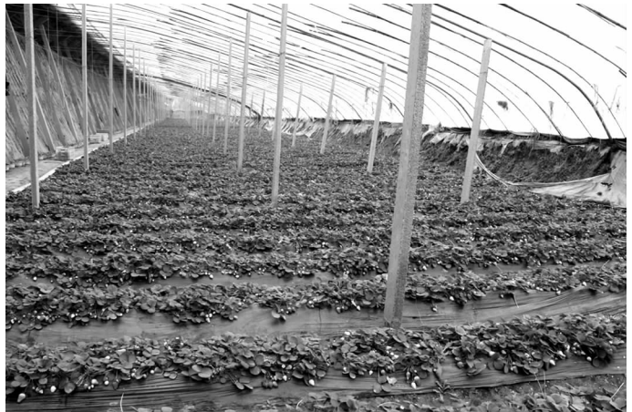
瑞之源农业无公害草莓大棚

2013 年底公司总产值 6062 多万元，固定资产达到了 4260 多万元，年销售收入 8484 万元，2013 年 6 月，被许昌市人民政府授予“农业产业化市级龙头企业”。