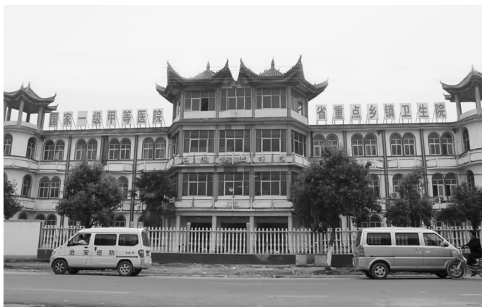
省重点乡镇医院——石固镇卫生院

民国十九年（1930）八月，西北军军医孟杰回乡，在石固开办首家西医医院——石固广仁医院，长葛始有西医。