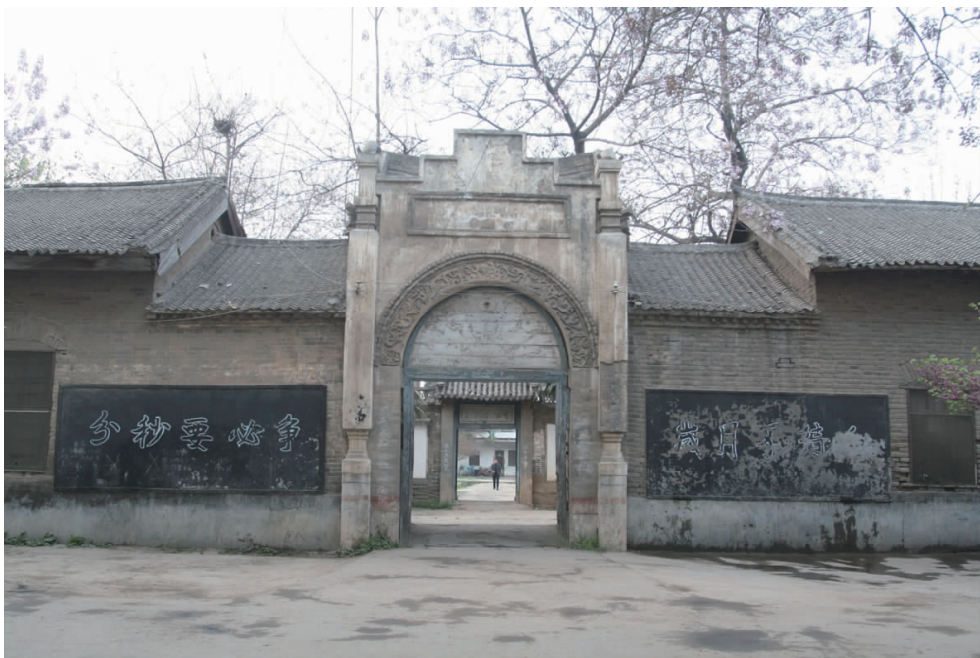
许长蚕桑中学旧址