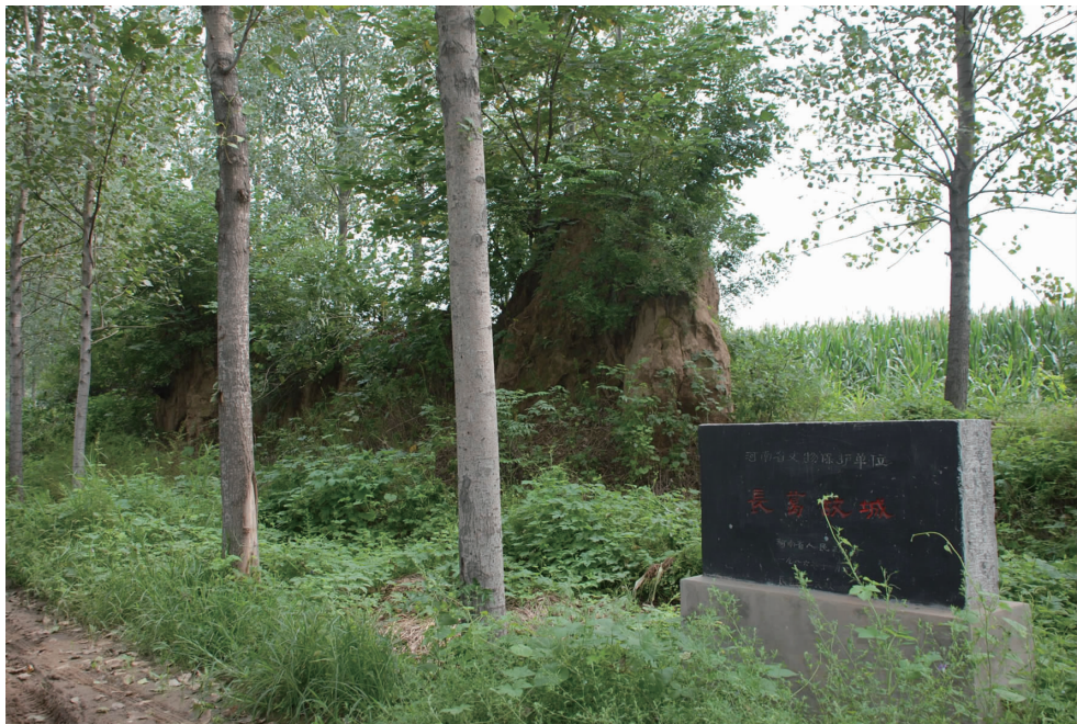
位于官厅乡大孟的长葛故城