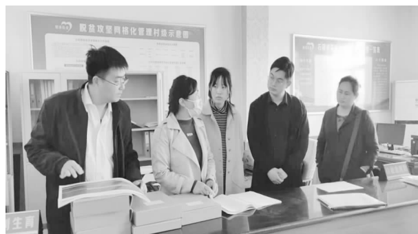
开展档案工作服务农村基层社会治理试点业务指导

【业务指导】 一是高度重视、周密安排，联合市扶贫办制订扶贫档案规范整理办法。对脱贫攻坚档案资料的整理及装具的统一使用进行规范和要求，改变之前各相关部门对档案收集不齐全、组件（卷）、分类、排列、编号不规范的状况。二是成立业务指导组，由业务骨干带队，利用周末休息时间深入重点镇村，对档案的收集归档和规范化整理进行现场讲解和指导，并选派责任心强的工作人员协助整理，确保档案的完整、规范和有效利用。