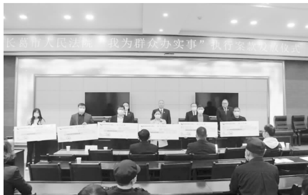
长葛市法院集中发放1269余万元执行款

【民生权益保障】 全面落实全省城乡居民人身损害赔偿的统一标准，有效解决城乡居民“同命不同价”的问题，审结机动车交通事故责任等人身损害赔偿类案件997件。深化家事审判改革，维护妇女儿童合法权益，审结婚姻家庭案件822件，加大反家暴力度，及时签发人身安全保护令，促进和谐家庭建设。积极稳妥审理新类型劳动争议纠纷，依法保障劳动者的合法权益，审结相关案件298件。加大惩处拒不支付劳动报酬犯罪力度，帮助农民工追讨欠薪，执结涉农民工工资案件49件，执行到位金额5463.51万元。充分发挥司法救助扶危济困作用，为困难当事人减缓免诉讼费，发放司法救助金104.7万元，让生活困难的当事人打得起