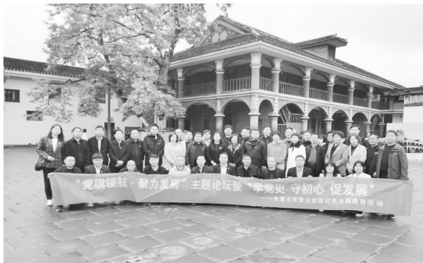
葛商读书会党史学习活动

【能量宣传】 出版《葛商》杂志，通过杂志对全市各商业、企业的形象进行正面宣传。截至2021年底，已刊印4期，第5期《葛商》杂