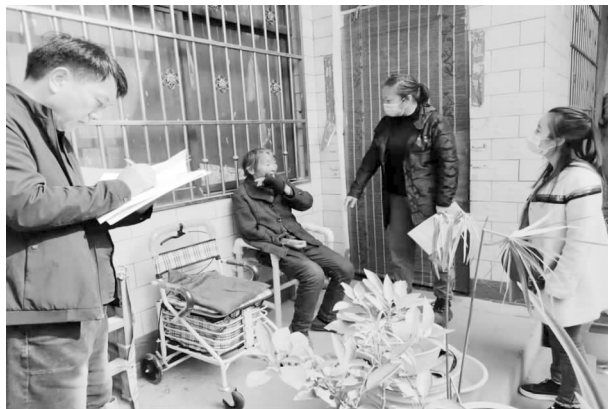
重度残疾人无障碍设施改造进行验收

【重度残疾人无障碍设施改造】 做好建档立卡重度残疾人家庭无障碍设施改造工作。全年共对177户重度残疾人家庭进行无障碍改造，主要包括轮椅坡道、过道扶手、灶具台升降及安装沐浴椅、坐厕器、升降毛巾架等，为重度残疾人的家庭生活提供便利。