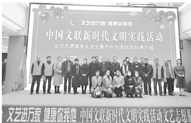
12月5日，“文艺进万家·健康你我他”中国文联新时代文明实践文艺志愿服务活动

【新时代文明实践志愿服务】 1月份，市文联带领市书法家协会、美术家协会、市民间文艺家协会的文艺志愿者们到大周镇大尚庄村、董村镇柳庄、建设路街道团结巷社区开展“迎春送福写春联”新时代文明实践文艺志愿服务活动。3月份，先后组织文艺志愿服务者在坡胡镇文体中心、石固镇乔庄村、长社办西岳庄、益民街社区、大周镇后吴社区开展“文艺进万家健康你我他”新时代文明实践学雷锋文艺志愿服务活动。12月份，长葛市被中国文联确定为“文艺进万家·健康你我他”新时代文明实践志愿服务试点。市文联组织各文艺家协会志愿者进行为期一个月的活动集中展现。市音乐舞蹈家协会等志愿者们走进后河镇王买村、书法家协会以“宪法进机关”为主题到建设办政源社区、中创国际博览城；市作家协会在市一高组织开展“经典诵读”进校园、市戏剧曲艺家