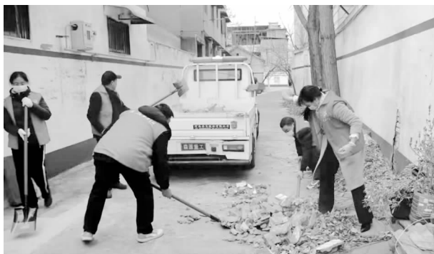
人居环境整治攻坚行动

【聚焦民生提质】 一是围绕群众居住难，高质量推进老旧小区改造项目。2021年启动溢翠苑、印刷厂家属院、毛纺厂家属院、金属回收公司家属院等16个老旧小区改造项目。在改造过程中，坚持“三问于民”，成立老旧小区改造一线党支部，积极推动老旧小区连片改造，把老旧小区与背街小巷打包提升，强化利益统筹，确保实现改造最少成本、最大效益。二是围绕群众停车难，高标准建设渑水路公益立体停车场。该项目是市政府民生实项目，位于