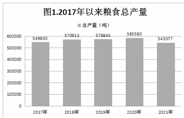
表 1. 主要农产品产量及增速