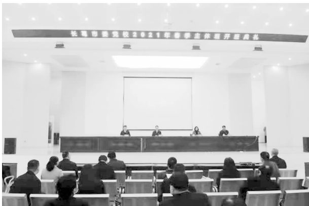
春季主体班开班典礼

的培训资源优势，承接社会各界培训班 10 期，培训 1500 多人次，为全面提高党员干部整体素质和能力，进一步加强党员干部队伍建设作出应有的贡献。