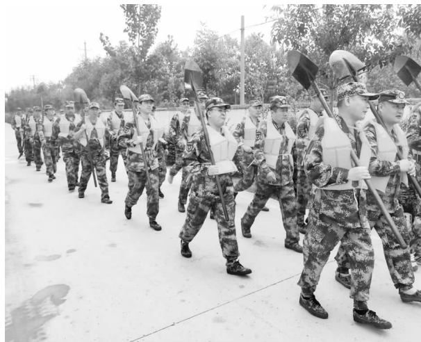
7月23日，增福镇民兵应急排急赴南席马武抗洪一线

疫情的冲击，坚持“四早”原则，科学应对，精准施策。医务工作者白衣为甲、逆行出征，镇村干部闻令而动、冲锋在前，广大群众、志愿者积极配合、团结一心，筑起护佑生命的铜墙铁壁，疫情防控工作取得阶段性胜利。