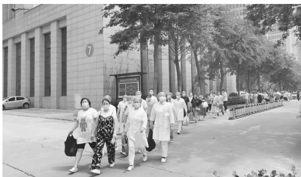
8月1日，长葛市12支共200人的医护支援队第一时间赶赴新郑，支援新郑开展核酸检测

点，一刻没有停歇，坚决守护市民健康防线。8月5日，许昌确认新增1名新冠肺炎确诊病例，许昌市中心城区开始进行全员核酸检测。8月6日上午，长葛市卫健系统再次抽调274名医护人员赶赴许昌各地帮助开展全员核酸应急采样工作。