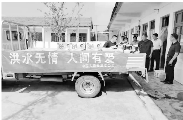
向受灾乡镇捐赠生活物资

【慈善公益】 2021年向慈善总会共计捐款2万余元。在“7.20”暴雨灾害发生后，积极捐款捐物，向受灾乡镇大周镇、董村镇、古桥镇、南席镇捐赠矿泉水、面包、方便面、84消毒液、消杀用具等物资约2万余元，广大营销员