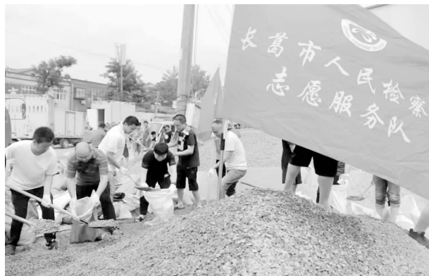
“7.20”长检志愿队支援董村镇李河口抗洪

村近 2 万名群众，服务全市防汛救灾大局。二是做好疫情防控工作。新一轮新冠疫情发生后，迅速启动战时机制，成立领导小组，形成“一把手负总责”，局领导分兵把口，各单位主要负责人共同参与的工作机制。共核查涉疫情指令 651 条 23845 人次，为快速、精准圈住封死疫情提供强力保证。在各项安保工作中、在防汛、防疫期间，公安机关应急值守 23 天，视频调度 100 余次，参与中层人员 1200 余人次。三是深入推进放管服改革。依托“互联网+公安政务服务”平台，更多事项实现“网上办”“掌上办”，全年共办理各类业务 50 多万件，真正实现让数据多跑路，让群众少跑腿。四是扎实开展万人助企联镇帮村工作。局党委班子成员、内设机构负责人、包村民警对分包的 54 家企业累计走访 735 次，开展调研 73 次，组织座谈会 65 次，收集企业意见建议 12 条，收集企业反映的问题困难 30 余条。万人助企活动办交办问题 9 条，联镇帮村活动办交办问题 1 条，均已办结完成，办结率 100%，企业满意率 100%。