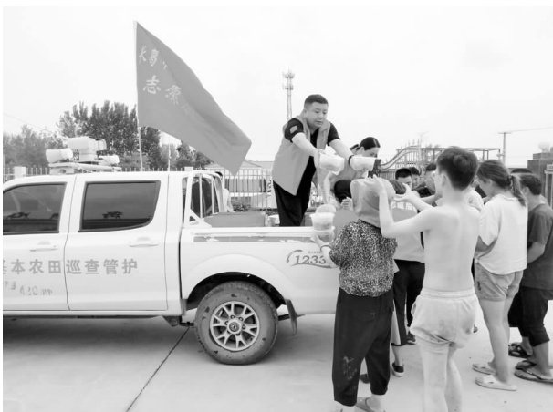
2021 年 7 月 22 日，长葛市自然资源和规划局志愿者为大周镇防汛救灾安置点群众送爱心餐

【地质灾害防治】 加大对地质灾害隐患点的巡查力度，向防灾区、受地质灾害威胁的村庄群众宣传地质灾害防治的基本知识，发放防灾图片、避险卡 1000 多份，制订应急预案，在重