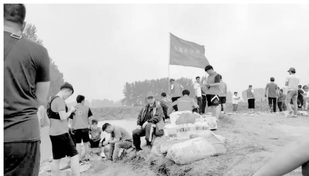
市供销社抗洪救灾突击队和广大干群一起，装沙袋、扛沙袋，奋力堵塞决口

【抗洪救灾】 7月21日凌晨，市供销社党组接到市防汛指挥部紧急通知后，立即组织机关全体男同志以及市区社和棉麻公司人员组成抗洪救灾突击队全力奔赴李河口水闸防洪一线。抗洪救灾突击队冒雨到达董村镇李河口水闸，查看河道水位情况，与沿河各村两委干部进行实时巡查，时刻关注水情水位。7月22日上午，市供销社党组了解到大周镇、老城镇、董村镇和新区体育馆安置点的群众缺少水、食物、被子等生活必需品，第一时间组织社属商贸中心、石固供销社，协调爱心企业三盛超市等为安置点受灾群众捐赠矿泉水、面包、夏凉被、床垫、卫生用品等价值21962元的爱心物资。