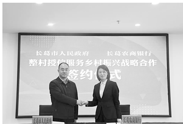
4月份，长葛农商银行与长葛市人民政府整村授信服务乡村振兴战略合作签约仪式

金”，积极与各行政村村委对接，由村委成立授信工作小组初步筛查，村干部、党员、村民代表组成评审小组进行评审，确定信用条件后，为农户授信贷款额度。让有资金需求的农户足不出村，贷款到户，以金融活水滋润农业、农村发展，切实助力乡村振兴战略实施。全年累计在全市98个行政村开展“整村授信”，覆盖农户4679户，授信金额达3950万元。