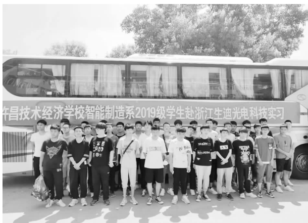
2019级学生奔赴实习地点实习

管理规定》经多次考察遴选，最终选择4家最为适合学生的实习企业。由各系部选派的带队指导教师陆续带领2019级310名学生奔赴实习地点实习，圆满完成为期六个月的封闭实习实训。文化艺术系128名学生在本地幼儿园，医学教育系68名学生在长葛市人民医院也同步完成实习实训。集中规范实习为学校高质量招生、教学、实习、就业的闭环管理补上重要的一环，实习管理步入正轨。