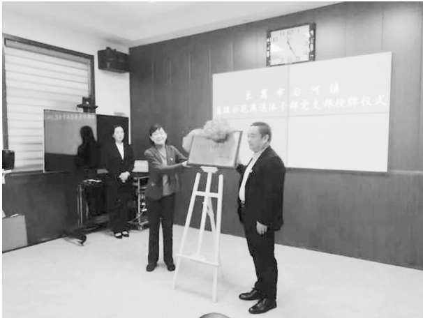
在市委党校举办全市离退休干部党组织书记培训班

【落实老干部“两项待遇”】 2021年上半年，组织老同志阅读文件、听报告，组织老干部参观红色基地，邀请老干部参加通报工作会议，参加市十四次党代会。春节期间，市委书记、市长带头联系走访慰问离退休干部；“七一”前夕，对全市离退休干部老党员进行走访慰问，与老党员、老干部谈心交流，面对面征求老同志的意见和建议，着力解决老干部反映的实际问题。在市委市政府的重视关怀下，全市离休干部离休费做到按月足额发放，医疗费按照规定实报实销。离休干部建党100周年增发基本离休费全部落实到位，该项工作在许昌市率先完成。5月份对所有离休干部和实职县级退休干部进行全面健康检查，市四大班子主要领导到市人民医院看望参加体检的老干部，并要求医务人员周到细致地为老同志做好每一个项目检查，切实保障老同志的身体健康。