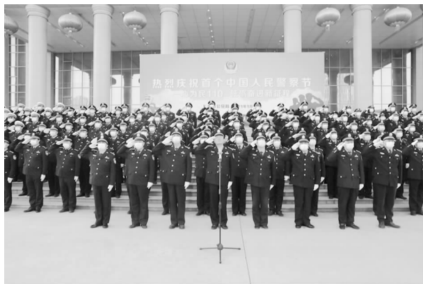
1月10日，市公安局隆重庆祝第一个人民警察节

【概况】 2021年，以党的十九大及十九届历次全会精神为指导，深入贯彻全国公安厅局长、全省公安局处长会议精神，以庆祝建党100周年安保为主线，以党史学习教育为动力，以公安队伍教育整顿为保障，以提高预测预警预防各类风险能力为着力点，切实履行好维护国家安全、社会安定、人民安宁的重大责任，进一步增强人民群众的安全感和满意度，确保全市政治稳定和治安大局持续平稳。