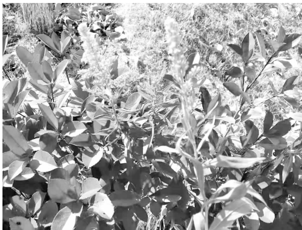
排查防治“加拿大一枝花”

【疫情防控】 8月份，严格按照全市防控部署，积极筹集防控必要的口罩、酒精、消毒液等防控物资，组织全体干部职工，在做好机关办公场所和个人防护的同时，抽调6名同志参加古桥镇3个村的疫情防控工作，连续工作20