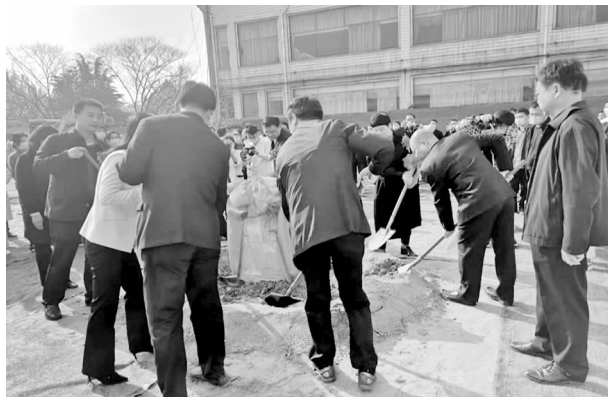
4 月 9 日，病房楼建设项目奠基仪式现场

方米，其他用房 1139.3 平方米），地下建筑面积 15719 平方米，床位 300 张。4 月 9 日，病房楼建设项目奠基仪式在新院区（位于钟繇大道以西、黄河路以北）隆重举行。至年底病房楼建设基础及主体九层施工已完成，准备进行主体 10 层施工。