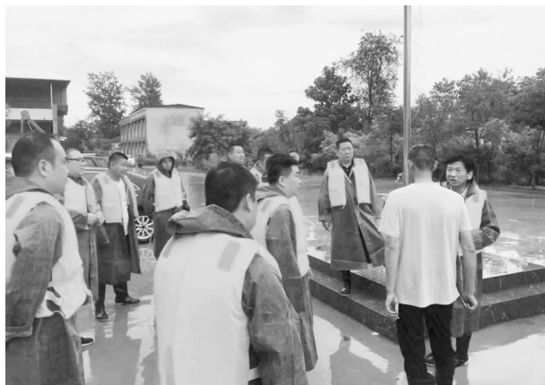
7月21日，市民政局全力以赴投入防汛抢险任务

【防汛抗灾】 7月21日，长葛市防汛应急Ⅰ级响应。市民政局立即启动应急预案，组织由24名党员干部组成的防汛抢险突击队第一梯队火速集结，先后奔赴分包的董村镇大墙王村、竹园董村及分包河段进行群众转移安置，迅速完成分包村740户3130名群众转移安置工作。随后，民政局党员干部转战古桥徐王赵村、董村李河口村堤坝段执行装填沙包、垒包筑坝等抗洪抢险任务，连续奋战36个小时。组建防汛突击第二梯队，为临时安置点群众及时提供被子700条、矿泉水1000箱、方便面300箱。防汛期间，积极投入受灾群众转移安置工作，指导帮助慈善总会接收社会捐款1123万元，网上募捐1000万元，接收社会捐赠物资19.5万件。省市慈善会拨付专项救灾资金1.2亿元。该局向上级争取364万元用于受灾困难群众临时生活补助，共救助受灾困难群众4393户10223人。