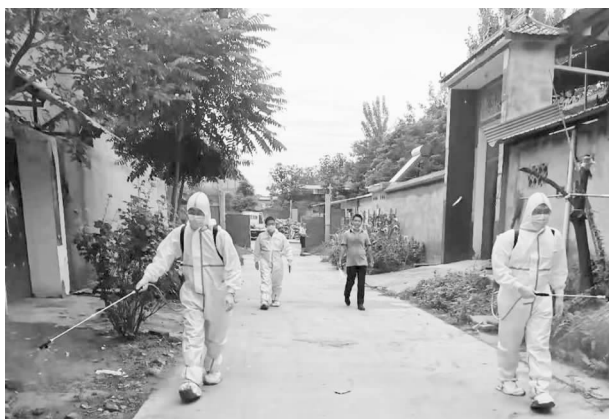
南席镇西街村消杀

【疫情防控】 一是根据省市级疫情防控文件要求，规范设置预检分诊和发热哨点。二是规范设置隔离缓冲病房。三是落实好儿童和孕产妇院内防控各项措施。四是切实做好医疗机构院感防控工作，强化感控培训，加强院内医疗废物的管理。五是按照疫情防控指挥部要求，保健院设立临时疫苗接种点，抽调医护人员参加疫苗接种工作。2021年为18岁以上人群接种36491人次，加强针接种2208人次，3~17岁人群接种12906人次。