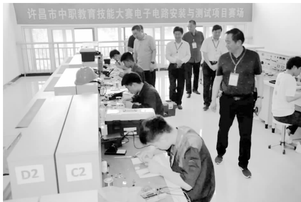
技能大赛电子电路安装与测试项目赛场

【学生竞赛活动】 学校在许昌市教育局举办的2021年师生技能类大赛中，全校共组织教师组13名教师参加动画片制作等7个项目、学生104人次参加21个项目技能类大赛，其中学生组共获13个一等奖，23个二等奖；教师组共获得3个二等奖。省级职业教育竞赛活动中有6名教师参加5项教师组比赛、27人次参加15项学生组比赛，其中学生组共获得一等奖4项、二等奖18项，三等奖15项。