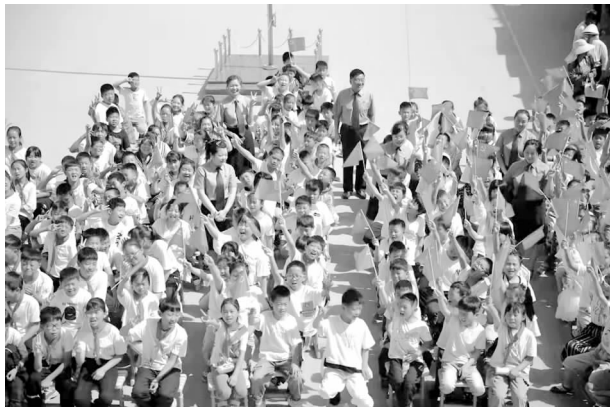
第五检察部开展“检爱同行共护未来” 检察开放日活动

发性犯罪 260 人，守护群众“钱袋子”和“米袋子”。惩治电信网络诈骗、帮助信息网络犯罪以及利用网络赌博、泄露个人信息等犯罪 93 人，立足检察职能落实“断卡行动”部署，维护社会和谐稳定。二是全面打赢扫黑除恶专项斗争。按照扫黑除恶机构不撤、人员不减、标准不降、力度不减要求，做到“是黑恶犯罪一个不放过、不是黑恶犯罪一个不凑数”。强化扫黑除恶法律监督，从高某寻衅滋事案件中发现一农村家族恶势力犯罪线索，已追捕 7 人。围绕“六清”，深入开展涉黑恶案件“回头看”，完成扫黑除恶专项斗争检察情势调研分析，确保除恶务尽和坚守法治相统一。三是悉心护航未成年人健康成长。积极履行“国家监护人”职责，落实“教育、感化、挽救”方针，批捕 36 人，起诉 39 人；对罪行较轻并有悔罪表现的未成年人不起诉 6 人、附条件不起诉 11 人。主动聘任 2 名心理咨询师为涉案未成年人进行心理辅导，与幸福源泉社工服务中心签订帮教协议做细帮教活动，不起诉未成年人再犯率持续下降。持续推动最高检“一号检察建议”落地，与 14 家单位共同落实侵害未成年人案件强制报告和涉性侵害违法犯罪人员从业限制制度。全面推行检察官担任中小学法治副校长制度，