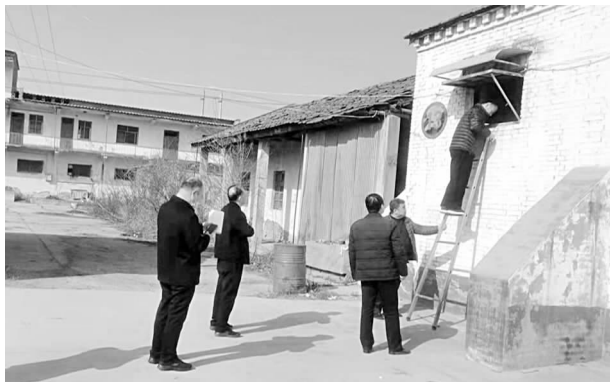
长葛市支行领导到收购库点进行监管

【粮食收购】 粮食收购一直是农发行高度重视的常规性工作，作为长葛市 8 家托市粮收购库点监管单位，始终以农民利益、保障粮食安全、维护社会稳定为宗旨，积极履行粮食库存管理工作，在异地粮食监管的决策中起着重要的作用，保证粮食库存安全，切实保护种粮农民利益。