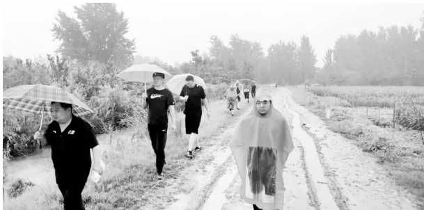
7月21日，体育发展中心干部职工赶赴汛灾一线开展防汛救灾工作

情防控工作，设立老体委家属院疫情防控点，并安排工作人员协助桥北社区开展疫情防控，圆满完成疫情防控任务。