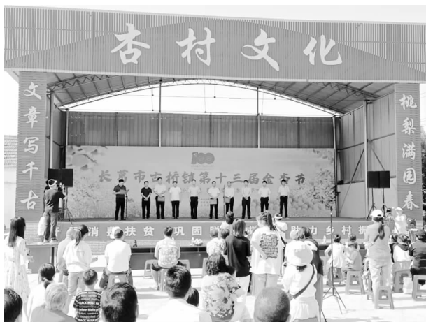
举办长葛市古桥镇第十三届银杏节

【生态文明】 一是推进特色产业发展。以师庄村“国家级森林乡村”为依托，鼓励各村复制师庄村“五统一”模式管理，着力发展特色林果业，辐射带动周边村庄利用房前屋后、荒宅荒片栽植多种经济型果树 18000 余株，形成以师庄、曹刘为主的银杏示范村，以本庄为主的黄金梨示范村，以刘李、魏庄为主的冬枣示范村等，师庄村已成功举办十三届银杏采摘旅游节，户均增收 3000 元，师庄村也先后被评为全国生态文化村、国家级“森林乡村”、省级生态村、省旅游示范村等。二是推进文明乡风创建。抓好农家书屋等宣传文化阵地建设，健全“一约五会”，推选新乡贤理事会，倡树文明新风，不断推动文明村镇创建工作。组建党员志愿服务队、大学生志愿服务队、青年突击队、巾帼志愿队参与疫情防控、抗洪救灾、人居环境整治等工作；成立红白理事会，遏制婚丧嫁娶大操大办、推进殡葬改革；开展“道德模范”评选、“星级文明户”认领，举办“孝道文化大餐”活动等，使群众的文明意识、文明程度不断提升，使自治、法治、德治“三治融合”的乡村治理新模式不断提升水平，持续营造向善向上的社会氛围。