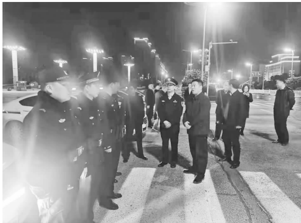
2021年11月10日，冬季治安“大排查、大巡逻、大防控”警灯闪烁专项行动进行动员部署

【政法综治和平安建设】 一是全力抓好矛盾纠纷排查化解。市平安办印发《全市集中开展矛盾纠纷“六防六促”专项行动方案》，明确职责分工和职能范围，在各个辖区迅速开展矛盾纠纷“六防六促”排查化解工作，切实杜绝民转刑案件发生。以综治中心为平台，以司法所、矛调中心为依托，深入开展矛盾纠纷大排