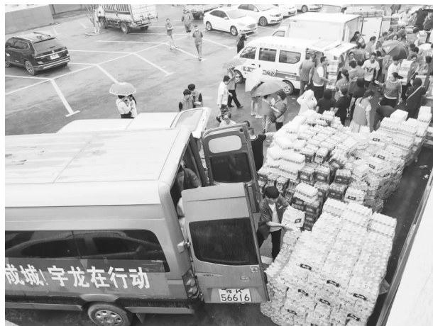
“7.20”水灾企业捐赠现场

【社会责任】 3月5日，长葛市举办首届“新时代文明实践推动周”暨学雷锋志愿服务月活动启动仪式。长葛市工商联（总商会）宣传、组织14家会员企业进行捐款，共捐金额4.7万元。6月4日，在长葛市2021年“学党史办实事”“爱心助考”新时代文明实践公益活动启动仪上，市汽摩协会、金桥商会、建筑机械商会、蜂产品协会、食品安全与行业发展协会共向“爱心助考”活动捐赠太阳帽、保温杯、矿泉水等价值27600元。6月5日，市工商联联合市青年创新创业联合会和市顶墙装饰材料协会为长葛市一高的考生送去矿泉水200件，价值5000元。高考期间，卫浴贸易商会免费为考生家长提供休息场所。7月20日，长葛水灾发生后，长葛市工商联第一时间发出企业互助自救倡议，并积极组织广大企业和商会进行防汛救灾捐助，先后组织11批次价值1370万元救灾物资和现金捐赠到受灾镇、村，充分展现互助的葛商精神。