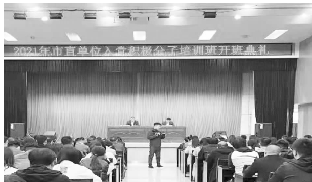
4 月 26 日，市直工委在老干部局举办 2021 年市直单位入党积极分子培训班

【基层党组织建设】 一是换届选举扎实推进。建立市直机关基层党组织任期届满提醒制度和换届选举工作台账，督促指导 94 个基层党组织进行换届选举、补选委员、书记，基层党组织更加坚强有力。组织召开市直党代表会议，选举出席市第十四次党代会代表 48 名，为圆满完成会议任务提供强有力保障。二是党员队伍持续优化。严把党员入口关，全年共发展党员 175 名，其中大专以上学历占 94%，40 岁以下占 75%，党员队伍持续优化。全年举办 4 期培训班，对 233 名入党积极分子、201 名党员发展对象、120 名基层党组织书记进行集中