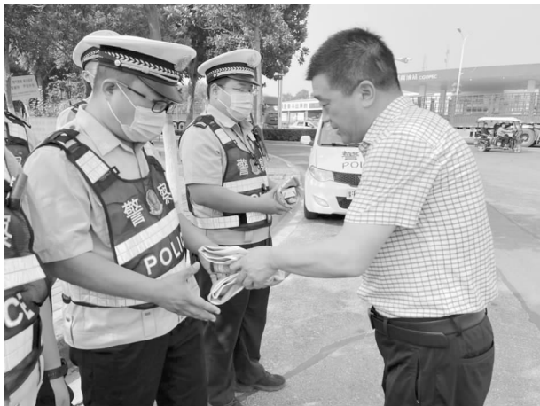
市总工会开展“送清凉”活动

【打造工会品牌工程】 一是“冬送温暖”。2021年，元旦、春节期间，共筹集资金22.2万元，救助困难职工270人。二是“春送岗位”。通过河南省工会移动互联网服务管理平台和省总豫工会APP，上传长葛市企业用工信息262家，提供岗位7031个，涉及200多个工种。三是“夏送清凉”。7月份，对全市一线环卫工人、交警以及7家企业进行走访慰问，发放矿泉水、毛巾、香皂、花露水等10余万元降温物资。四是“金秋助学”。共救助贫困学子37名，救助金额15万元，其中，困难职工子女25名，