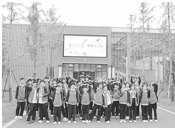
湿地科普宣教馆室外宣传屏

【湿地科普教育】 一是主题日活动多样化。开展“世界湿地日”“爱鸟周”“世界环境日”“全国科普日”等主题日活动，组织“湿地知识进校园、进社区、进乡村”、科普讲座、科普培训等宣教活动40余次，充分发挥科普教育职能，打造湿地科普教育胜地。二是湿地体验独具特色。组织开展丰富多彩的湿地观鸟、湿地采风、亲子体验、互动游戏、湿地写生等湿地体验类活动40余次，社会效果良好。三是科研教学“第二课堂”。联合高校开展生物多样性监测、社会实践等活动30余次，不断探索科普形式，打造科研教学“第二课堂”。