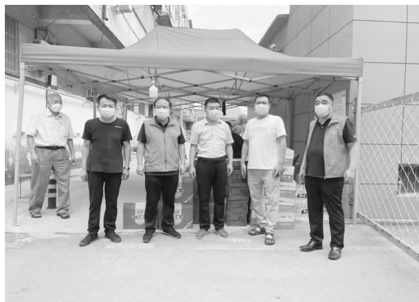
市总工会到社区疫情卡点送慰问物资

【服务社会】 市总工会为受灾严重的镇、产业集聚区以及疫情防控社区卡点送去方便面、矿泉水、火腿、消毒片、口罩等救灾、防控物资，价值 20 余万元，下拨防汛救灾、疫情防控专项资金 35 万元，以实际行动体现工会组织的责任和担当。