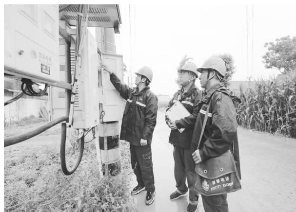
9月1日，冒雨巡视确保台区安全供电

动，30小时27分钟全部恢复用电。面对历史罕见的“7.20”特大暴雨及洪灾险情，组织23支党员突击队，创下80多小时恢复全市6.3万停电用户送电的“国网速度”。