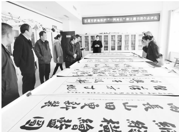
2021 年 10 月 26 日，长葛市耕地保护“一网两长”制书法作品评选

【耕地保护】 出台相关文件，从制度上加强和规范耕地尤其是永久基本农田管护，完成许昌市绕城高速公路（长葛段）307.09 公顷永久基本农田项目补划工作，并顺利通过省厅审核验收。“一网两长”制落地生效。全市共设立各级田长 907 名、网格管理员 305 名，形成市、镇、村“三梯并行、多维联动”的“田长制”网格架构，构建“横向到边、纵向到底、相对独立、职责清晰”的全域网格化管理体系。