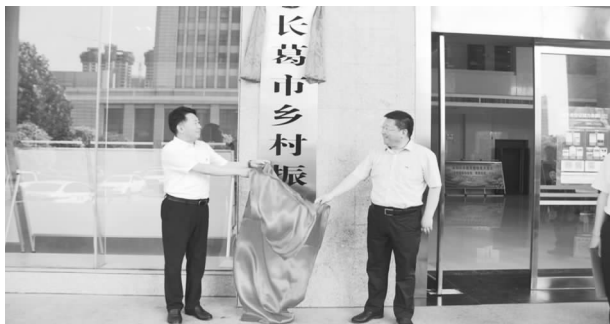
6月11日，长葛市乡村振兴局正式挂牌

【重组挂牌】 按照上级要求，长葛市扶贫开发办公室重组为长葛市乡村振兴局，为市政府工作部门，由长葛市农业农村局统一领导和管理，其他机构编制事项不变。6月11日，长葛市乡村振兴局正式挂牌。