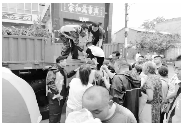
7月21日，长葛市气象局抗洪抢险志愿者在大周镇转移被洪水围困的群众

员前往大周镇开展抗洪抢险工作，协助转移受灾群众760余人，灾后向安置点受灾群众捐赠被褥108床，帮助受灾群众渡过难关，充分发挥气象为民，服务人民的长葛气象精神。