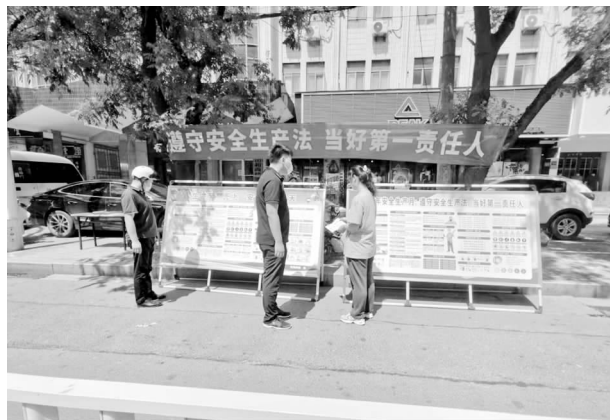
安全文化宣传教育

【安全文化宣传教育】 发挥线上微信平台、电视广播、主流媒体等，积极宣传新《安全生产法》、“5·12”减灾日、“安全生产月”、专项应急演练等系列活动的积极作用，开展全方位、全媒体、多层次宣传教育活动。一年来，发布各类重点时段、重点行业领域安全提醒36余次，微信公众号发布信息230期；开展应急演练56场次；培训企业主要负责人、管理人