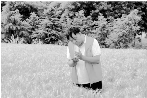
6 月 7 日，参与“三夏”禁烧的社区干部到麦田查看小麦是否成熟

辆次，全镇 10 名河道巡保员全天候上岗，做好河道保洁工作，确保全镇各条河道环境卫生。