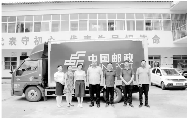
老城邮政支局志愿服务队去抗洪防汛一线捐赠物资

进行监督检查，随时调阅监控，确保邮件消杀，出入测温、登记、扫码，规范佩戴防护措施等各项制度落到实处。三是统筹安排疫苗接种与核酸检测。积极对接地方防疫部门，按照应接尽接原则，统筹组织全体职工进行疫苗接种。