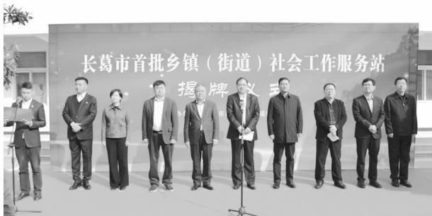
长葛市首批乡镇（街道）社会工作服务站揭牌仪式

【特色亮点】 长葛市按照“统筹规划、一体推进、全面覆盖”的原则，投资228万元，在许昌市率先建成全市12个镇社会工作服务站，打通服务群众“最后一公里”，受到河南省厅领导的充分肯定，许昌市其他县市区在长葛市观摩学习先进经验。10月22日，长葛市首批乡镇（街道）社会工作服务站揭牌仪式在增福镇政府举行。河南省民政厅一级巡视员尚英照、慈善事业促进与社会工作处处长童金玺、副处长丁兴魁，许昌市副市长汤超、政府副秘书长侯坡、民政局局长陈志远，长葛市市长张晓丽、政府党组成员吴星等相关领导出席仪式。许昌各县（市、区）民政局局长等到长葛市观摩社工站建设工作。