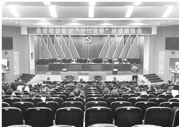
全市召开信访稳定“百日攻坚”活动动员会

【加强矛盾纠纷调处化解】 市矛调中心全年共接待来访群众 485 批次，现场调解和答复处理 324 批次，立案 161 起，调解成功 148 起，调解成功率 91.92%，绝大多数案件实现息诉罢访目标，把矛盾纠纷化解在源头，维护群众合法权益，减轻全市信访稳定压力，促进社会和谐稳定。