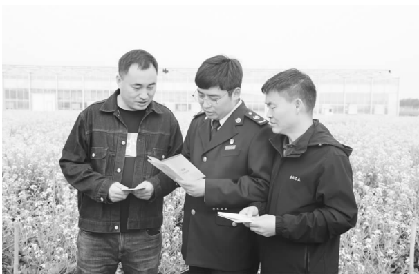
开展“税法宣传镇村行”活动

【减税降费】 始终站在讲政治的高度落实减税降费和支 持企业发展，编印《助力服务乡村振兴战略税收优惠政策汇编》，开展“税法宣传镇村行”，与纳税人进行面对面的宣传沟通；全年累计为企业减轻税费负担 14.6 亿元，四季度办理阶段性税款缓交 2240 户次，缓缴税款 10467 万元；推送减税降费红利账单 4000 余份，查看率 99.99%。