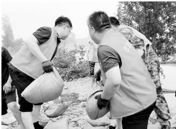
7 月 26 日，农改中心志愿服务队到南席镇马武村防汛救灾

【志愿服务工作】 一是每周由班子成员率领志愿服务队到结对帮扶的老城镇头堡村社区开展“双报到双报告”暨志愿服务活动。积极宣传疫情防控知识，开展端午送温暖、清洁家园等志愿服务活动 16 次。二是组建文明志愿服务队，招募志愿者参加志愿活动。在全省排名 1002 名，累计服务时长 6020.9 时，人均志愿服务时长 334.5 时。三是积极参与城市创建，深入开展“做文明有礼长葛人”志愿服务活动，