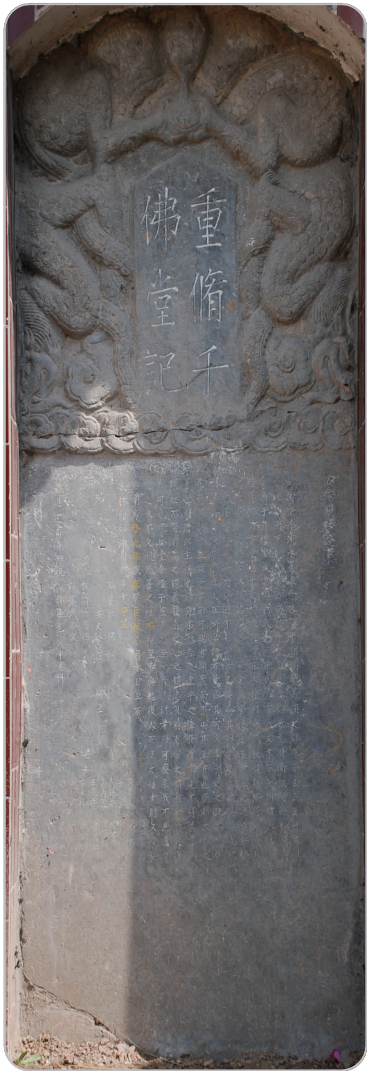
青石带题记莲花座佛像及重修千佛堂碑