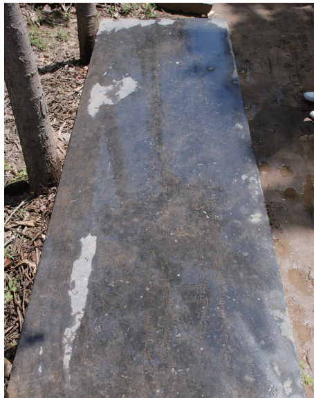
杨笃生父杨廷翰母梁氏救命碑

杨笃生父杨廷翰母梁氏救命碑位于长葛市南席镇全庄村，石碑为青石质地，碑文为楷书，字体刚劲有力、端庄大方，共350字。为清康熙三十六年（1697）下诏所立，主要内容为表彰杨笃生之父杨廷翰为官清廉、勤政爱民，母梁氏仪表端庄、品行贤淑、育子有方。现石碑存放于全庄村中，保存基本完好。2006年被长葛市人民政府公布为重点保护文物。