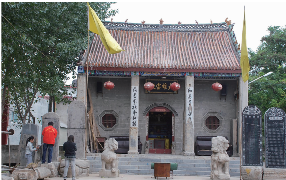
石固镇北寨东街观音寺