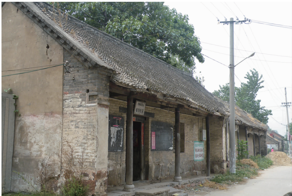
长葛旧县衙衙后街