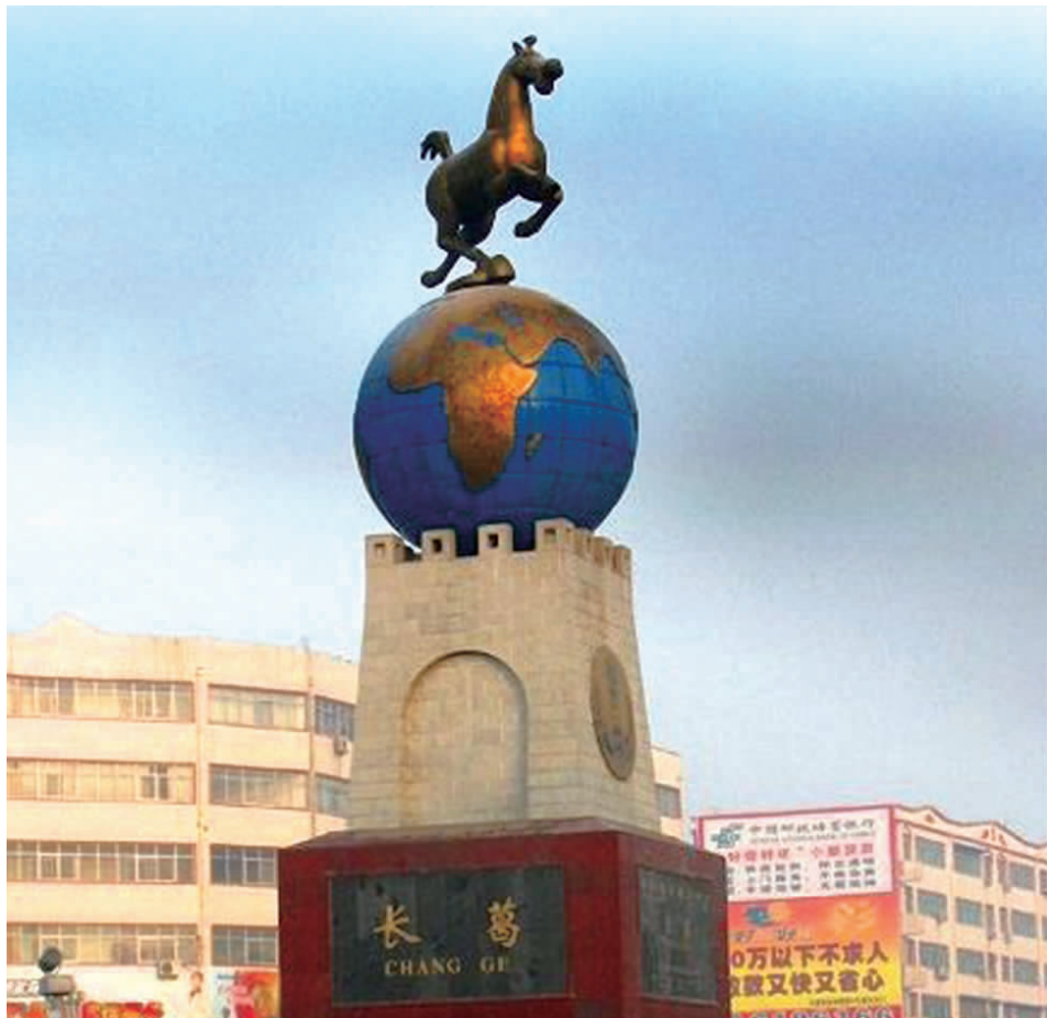
中国优秀旅游城市标志