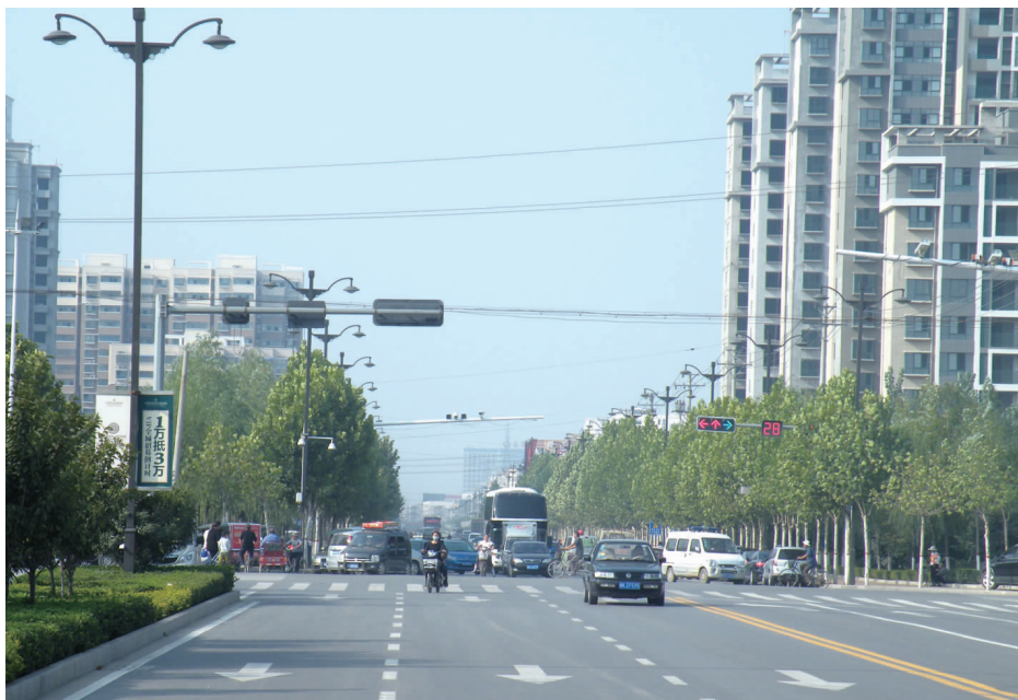
长葛市区建设路南段