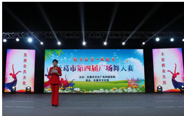
7月23日,在东区体育场举办“魅力长葛舞起来”第四届广场舞大赛

了文化活动品牌。依托南席镇开展的文化走亲活动成立“南席镇新时代文化联盟”,成为长葛市文化活动的亮点。6月1日,许昌市在长葛市南席镇召开现场推进会。三是持续开展群众文化活动,活跃群众文化生活。8月上旬,在后河镇王买村举行许昌市暨长葛市“舞动春晚”启动仪式及首场演出,举办长葛市第四届“魅力长葛”广场舞大赛和“出彩河南聆听乡音”第二届长葛戏迷大赛。四是狠抓文艺创作和文化惠民工程。邀请省内专家复排传统豫剧《黄鹤楼》,参加许昌市第八届戏曲大赛获得二等奖。全年开展戏曲名家进基层、送戏下乡、文艺轻骑兵、周末大舞台等惠民工程演出230场。