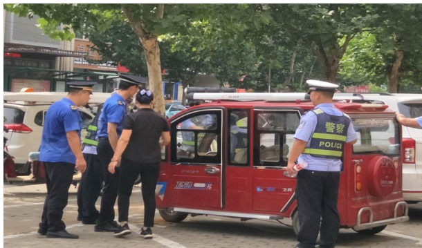
开展营运电动车辆整治

累计清挖雨水井 5000 余座，清挖清运淤泥 3700 余立方米。三是持续抓好清漯河、小洪河沿线雨水口排放口排放污水的问题，彻查源头，该实施封堵的一律封堵，确保雨水口在非雨天气不排放污水。对沿街餐饮商户逐一发放禁止乱倒污水宣传页 10000 余份，向商户讲解乱倒污水的危害，引导商户自觉处理好泔水、油脂、剩饭等，对沿街商户向雨水篦子乱倒泔水现象进行拍照取证，并转综合执法大队进行处罚，提高经营者维护公共环境的素质和意识。四是保障城市桥梁安全运行，委托专业桥梁检测机构对所管辖的郑和桥（葛天路）、人民桥（人民路）、建设桥（王庄桥头）、红旗桥（漯水路）、明珠桥（八七路）、赵庄桥（长社路）六座桥梁进行科学标准化安全检测，消除安全隐患，确保整个桥体的完好、安全、畅通。五是抓牢城市防汛工作。对城区 6 座排水泵站的泵机和电器设备进行全面维修、保养，确保排水设备处于良好运行状态；同时对长社、南环、黄河立交桥排水泵站蓄水池进行清淤。