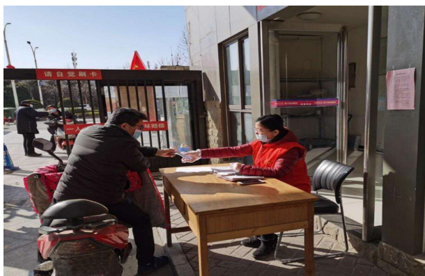
党员志愿者参与社区疫情防控

【文明单位创建】 扎实开展文明单位创建活动。以社会主义核心价值观为根本，重点以“全市文明城市、园林城市、卫生城市创建”