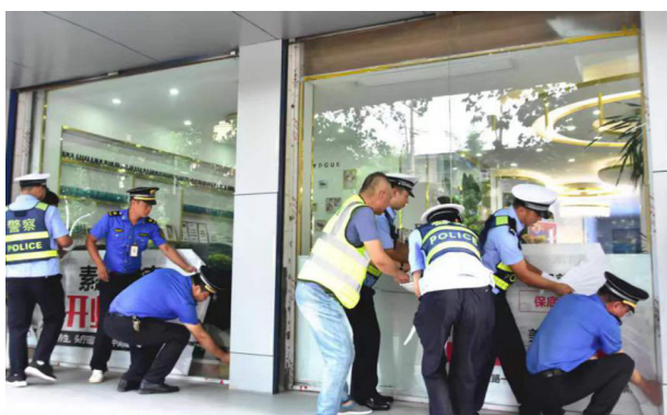
开展市容市貌集中整治

45 件，配合各镇（街道）开展联合执法行动 12 余次，对各镇（街道）下发私搭乱建督办 38 份，拆除违建 30 余处。二是对全市建筑工地进行四项专项检查：沉降水专项检查、起重设备专项检查、施工资质专项检查、预售许可专项检查。三是对清颍河河道城区段违建坚持日报告、零报告制度，进行早发现、早处置、早汇报，稳固现有清颍河建设成果，杜绝违建发生。四是配合老城镇政府完成高铁沿线综合整治，对沿线违建进行拆除。