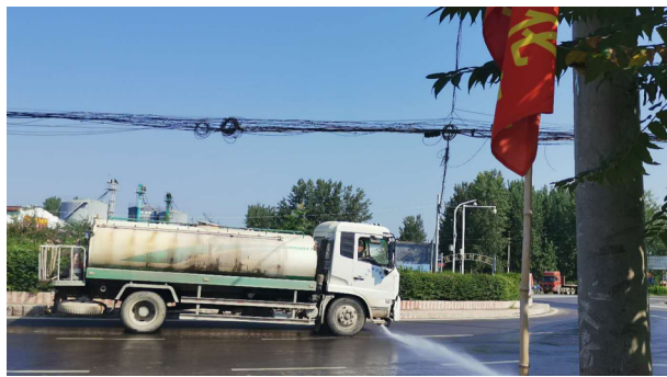
干线公路清扫、洒水及护栏清洗

完成了老 107 国道黄河路至新郑交界水泥路面断板处理, 共处理破碎板 11000 平方米, 沥青砂补平 2632 平方, 路面压浆 17697 平方。2. 利用春季大好时机, 出动各种机械 120 余台次, 人工 460 余个, 整修标准路基边坡 81400 平方米。3. 修复泄水槽 136 道, 计 286 米; 排水系统清淤 202.3 立方米; 修复排水沟 120 米; 清理垃圾杂物 320 余车。4. 路面灌缝 475033 米, 挖补坑槽 4800 余平方米, 处理沉陷 632 平方, 处理龟裂网裂 28530 平方。5. 补栽树木法桐, 胸径 10 厘米 358 棵, 胸径 14 厘米 73 棵, 栽植草皮 500 余平方米, 修剪绿化树木 16200 余株, 路树刷白 3800 余棵。6. 更换波型护栏 68 根, 更换标志标牌 12 处 (块), 冲洗护栏 5200 米。7. S325 京广立交桥新增设波形护栏 392 米; G107 增福庙立交桥、清漯河桥更换修复桥梁伸缩缝 160 余米; 桥梁防撞护栏粉刷 3620 平方。