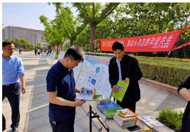
5·12 防灾减灾宣传周宣传活动

【安全生产】 一是行政执法。切实履行好安全督察组职责，每周安全督导工作不少于两次。开展行业内防雷防静电安全检查，对长葛所辖的加油站、化工企业等易燃易爆场所进行安全检查。二是安全生产宣传活动。在 5·12 防灾减灾日、6 月份安全生产月利用线上线下等方式开展气象灾害防御宣传活动，线上阅读量累计达