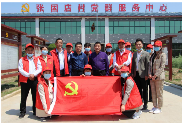
长葛市产业工人队伍建设

【工人队伍改革】 长葛市各类企业达 6300 多家，职工 20 多万人，其中，产业工人 16.5 万余人，农民工 11.7 万余人，分布在全市 12 个镇、4 个街道和市产业集聚区、大周产业集聚区。2020 年，市总工会成立产业工人队伍改革领导小组，积极与人社局、组织部、财政局、