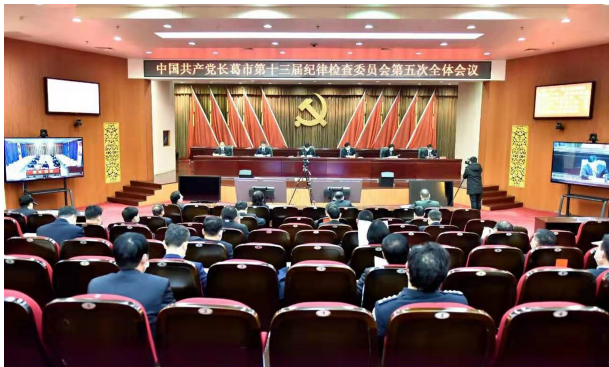
2020年，3月3日上午，中共长葛市第十三届纪律检查委员会第五次全体会议召开

【综述】 2020年，长葛市纪委监委在许昌市纪委监委和长葛市委的领导下，认真学习贯彻习近平总书记重要讲话和指示批示精神，围绕机要做好“六稳”工作，全面落实“六保”任务，充分发挥监督保障执行，促进完善发展作用，一体推进“三不”，有力推动全市党风廉政建设和反腐败工作持续向纵深发展，为全市经济社会发展提供坚强纪律保障。荣获河南省文明单位。