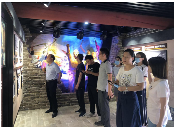
参观学习红色教育基地

【参观红色教育基地】 2020年7月10日，市委编办全体同志一起前往中共许昌第一个支部委员会——中共豫陕区石固南寨支部委员会旧址、许昌第一个党组织——中共长葛组诞生地纪念馆参观学习。通过参观学习，进一步激发党员干部的历史责任感和使命感，加强党员干部的理想信念。同时，党支部书记按期讲授党课，结合党支部实际细化工作任务，明确责任分工，严格履行党建工作职责，充分发挥支部的战斗堡垒作用和党员的先锋模范作用，切实做到年初有部署、年中有落实、年底有总结。