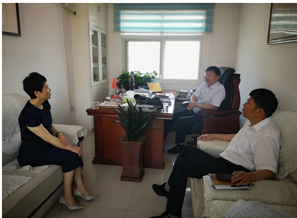
5月21日,市妇联听取古桥镇“五美示范庭院”创建工作的开展情况

【“五美示范庭院”创建工作】 2020年,市妇联把五美示范庭院创建工作纳入到美丽乡村建设总体框架,明确具体任务,制定具体措施,统一部署,统一考核,形成联动联建的创建合力。一是把“五美示范庭院”创建工作与美丽乡村建设工作统筹安排部署。4月初,市妇联与农改办结合,将“五美示范庭院”创建工作纳入长葛市2020年美丽乡村工作任务台账,对长葛市15个省级“千万工程”示范村、60个“四美乡村”、21个贫困村、9个挂牌督战贫困村、171个改厕整村推进示范点村明确创建目标。二是坚持因地制宜、妇联引导、群众参与的原则,为创建工作汇聚最广泛的力量。各级妇联组织充分发挥妇联执委、“四组一队”成员、巾帼志愿服务队的的作用,广泛宣传“五美示范庭院”创建工作,层层发动,动员广大妇女家庭参与。同时各级妇联组织还将“五美示范庭院”创建工作作为助推全市脱贫攻坚工作的具体举措,组织巾帼志愿者到贫困户家中开展扶贫助困、清洁家园活动,使环境卫生整治巾帼志愿服务行动家喻户晓、深入人心,为助力打赢脱贫攻坚战、美丽家园清洁贡献巾帼力量。