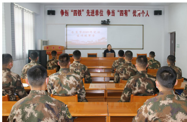
长葛市司法局组织律师开展“送法进军营”法治教育讲座

项斗争中。加强对全市法律服务队伍的规范化管理，不断提升法律服务效率。开展法律服务市场大整顿，依法取缔 9 家违规法律服务机构，净化长葛市法律服务市场，经验做法被河南省司法厅进行报道。发挥人民调解的职能作用，积极开展矛盾纠纷排查化解，全力维护基层社会稳定，全市范围内持续开展“矛盾纠纷大排查大化解暨命案防范百日行动”，共排查各类矛盾纠纷 2634 件，调处成功 2633 件。扎实开展脱贫攻坚，积极履行帮扶责任，推进班子成员和机关干部“走基层”常态化，组织党员干部深入到坡胡镇帮扶村，探索扶贫新模式，与驻村工作队结合，成立普法宣传队，以党的十九届五中全会精神、习近平法治思想和脱贫攻坚法律政策为主要内容，助力贫困人员法治脱贫，着力帮助解决好群众普遍关心和反映强烈的问题，推动村风民风好转，法治扶贫成效显著。基层基础建设创先争优，截至年底，全市现有 4 个河南省五星规范化司法所、4 个许昌四星规范化司法所；全市现有 3 个国家级、16 个河南省级、63 个许昌市级民主法治示范（村）社区。