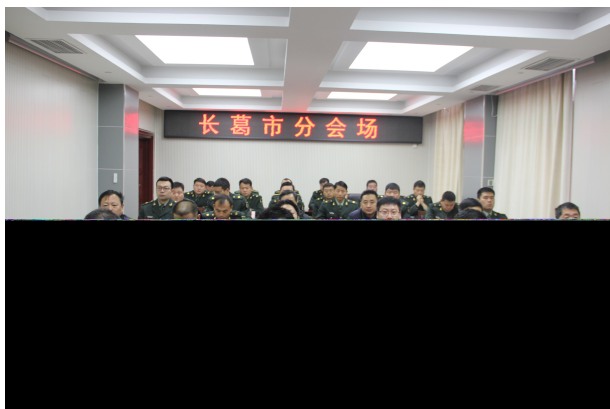
1月16日，长葛市分会场参加全国征兵工作会议

等活动，在全市营造尊崇军人、优待军属浓厚氛围。综合运用微信平台、电视讲话、征兵宣传车、标语横幅等多种形式开展征兵宣传，制作发放征兵宣传大礼包、文化衫、水杯、毛巾等8000余件套，群发短信5万条；对接教体局精准掌握全市在校男性大学生名单，逐人做好宣传发动。坚持“五公开、五公示”，严密组织征兵体检、政考，严格征兵疫情防控，预定新兵全程集中封闭管理，期间进行两次核酸检测，确保防疫工作不出任何问题。2020年，圆满完成新兵征集任务，大学生占比再创新高。