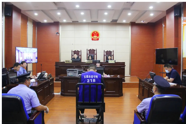
院长担任审判长，公开审理一起涉恶案件

【扫黑除恶】 扎实推进“六清”行动，系统谋划“六建”工作，坚决打赢扫黑除恶收官战。坚持依法严惩不动摇，以“零容忍”态度，对黑恶犯罪出重拳、下重手，自扫黑除恶专项斗争开展以来，审结涉黑涉恶案件 17 件 72 人，其中涉黑案件 4 件 32 人，恶势力犯罪集团 9 件 27 人，恶势力团伙 4 件 13 人。院长、主管副院长担任审判长审理 6 件。紧盯“黑财清底”任务目标，穷尽执行措施，彻底铲除黑恶势力经济基础，受理涉黑涉恶执行案件 10 件，执行到位金额 56.83 万元。对审结案件所折射的相关问题进行调研分析，有针对性发出司法建议，发出涉及基层治理、社会治安、文化教育等多个领域司法建议 14 份，取得良好的社会效果。