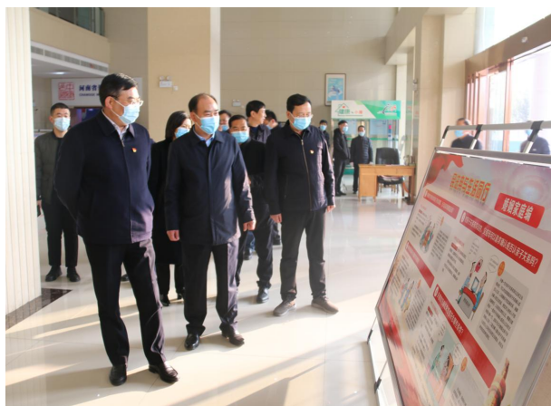
“12·4”国家宪法日系列宣传教育活动

典》、“普法进校园”和“普法宣传进社区”活动、“12·4 国家宪法日”系列普法宣传教育活动 60 余场次。在“12·4 宪法宣传”活动中,围绕七项重点宣传内容,采用九项主场活动和七项主题活动联合实施的方式进行,出彩完成宣传任务。组织律师、法律工作者到全市各中小学开展 12 期“第一堂法治课”讲座。为配合文明城市创建工作,组织全市 30 余家普法责任单位到 26 个重点社区开展大规模的普法宣传。全市有 26 个社区完成法治文化硬件建设,高标准打造建成 12 处“市镇村”三级法治文化广场、长廊、一条街宣传阵地,圆满完成“七五”普法总结验收。