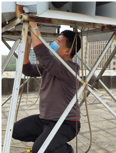
春季人防警报器设施设备检修维护

组织人防“三网合一”信息系统建设的使用维护培训,并完成同上级人防办应急指挥中心的互联互通调试;5月19日,成功组织信息系统的验收工作。通过联调联试和圆满完成验收任