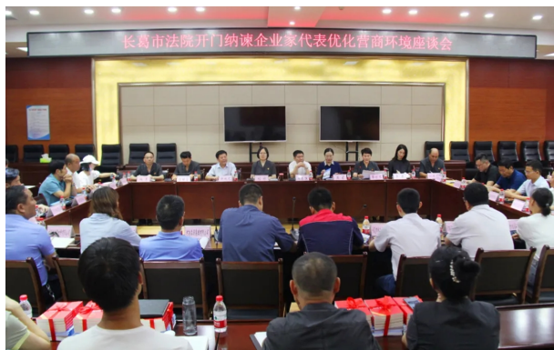
“请进来”开门问策，“面对面”互动交流——长葛市法院开展优化营商环境主题开放日活动

产、持续发展创造条件。受理各类破产案件5件，审结各类破产案件6件（含旧存案件），其中驳回申请1件，民营企业破产清算案件2件，兑付债权3236万元，房地产企业破产重整成功2件，解决债权数额7.85亿元，交付涉民生房屋228套，生产性企业破产重整案件1件，解决债权数额6.3亿元。抽调骨干力量组成工作专班，合力做好众品公司破产重整工作，涉17家众品公司、15家鲜易供应链依法进入合并重整程序，帮助众品食业重新启动肉类产业链，企业重现生产活力，取得良好法律效果、社会效果。