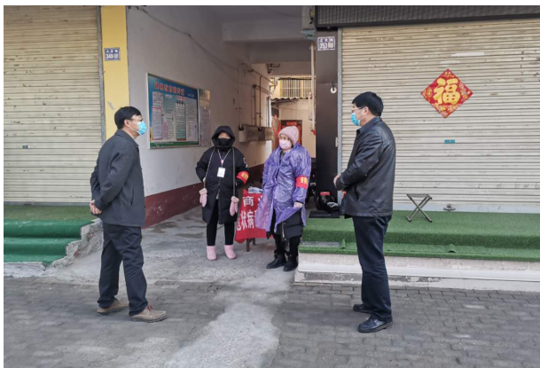
对家属院做疫情防控工作

成员带头，全体同志齐心协力，通过组织人员对家属院住户进行宣传，并发放宣传册 150 余份，悬挂横幅 13 条，微信群发布防控知识 120 余条，提高广大群众防控意识，并组织党员干部向疫情地区捐款两次共计 8500 元。同时做好疫情舆情信息收集工作，积极引导群众“不信谣、不传谣”，通过全体人员共同努力，较好地完成疫情防控工作。