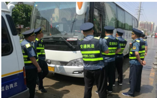
道路运输专项整治

【城乡道路客运一体化和“万村通客车提质工程”】 2020年,筹资900余万元,购置29台公交车,新开通城市公交线路2条,新开通镇村公交支线16条,建设智能信息化监控服务平台1座、客运招呼站98座和3个集物流、电商、快递等功能为一体的镇级综合服务平台。全市构建以市区为中心、镇为节点、建制村为末梢的三级城乡公交客运网络,实现村村通公交。6月18日,省交通运输厅对长葛市创建工作进行验收。公交惠民工程工作得到快速推进,城市公交和镇村公交已实现全市1元票价,对特殊群体实行免费乘坐城市公交。自3月27日起,对全市60岁以上老人及残疾人办理免费乘车卡、学生半价卡,截至年底,已办理敬老卡和爱心卡1813人。