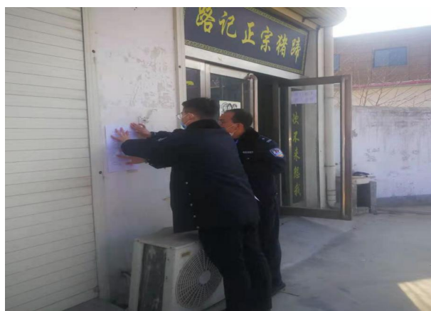
组织森林公安、林政执法大队开展“疫情联动巡查”活动

23次，出动车次62台次，发放宣传页2600份，悬挂疫情防控横幅150余条，张贴通告400多张，在全市野生动物驯养户、表演场所、集贸市场、餐饮酒店等66处场所检查违法出售野生动物制品的行为。采取张贴公告、发放《疫情防控告知书》、主导印发《长葛市人民政府关于设立禁猎区、禁猎期的通告》进行全域张贴等措施，广泛宣传食用野生动物制品带来的危害。全年共查处违法猎捕野生动物案件6起，收缴粘鸟网28张、猎捕野兔电瓶12块，行政处罚6人。通过密集的检查和宣传，大大提高全市人民保护野生动物和预防来自野生动物疫情传播方面意识。三是根据全市疫情防控部署，林业发展中心在整个疫情防控的关键时期，由班子成员带队，每天轮流对分包的佛耳湖镇各个村庄卡点值班情况、人员流动情况、村内环境卫生和防控消杀等工作进行督导检查，确保分包镇村不发生疫情。