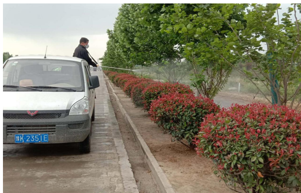
对植物检疫,联防联控

【病虫害普查与防治】 全年完成美国白蛾第一代普查,第一代普查自 4 月 14 日至 5 月 22 日,正在进行第二代普查。普查采用悬挂诱虫灯和实地踏查相结合的方式,坚持每周普查二次,每次三天,保持持续监测。悬挂地点主要选在南席镇、石象镇、大周镇、佛耳湖镇、老城镇等苗圃以及市区葛源路、黄河路等重点廊道,作为重点监测区域,共悬挂诱捕器 60 台。美国白蛾一代普查共覆盖林地面积 6.9 万亩,监测林木株数 7500 株,经普查未发现美国白蛾幼虫危害。2020 年林业技术推广、森林病虫害防治检疫和测报工作取得显著的成效,各项测报数据和测报信息实现全省联网,被国家林业局分别命名为“省级标准化森防站”和“国家级森林病虫害中心测报点”。从 5 月 12 日开始,林业发展中心森防站及时联合市公路局、城市园林、后河镇等单位对老 107 国道、325 省道、三号公路等重点廊道绿化树种上的蚜虫、方翅网蝽等虫害开展不间断联防联控。植物检疫作为是提前做好病虫害防范隐患的重要工作,6 月份林业技术推广站对全市本地苗木 2.3 万株进行检疫,检疫复检苗木 4.7 万株,未发现危险性林业有害生物,从源头上遏制了林业病虫害