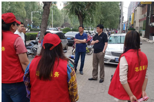
开展“文明天使”、治理“十乱三难”志愿服务活动

【创建工作】 为全力做好“三城联创”工作。总公司专门成立领导小组，明确目标任务，制定工作方案，广泛宣传动员。一是与所属临街门店签订“门前三包”责任书，落实“门前三包”责任制，使经营区域和门前人行道及空地的环境卫生得到改善。二是为提高“三城联创”的知晓率、满意率，营造浓厚创建氛围，总公司坚持“属地专注、注重成效、因地制宜”的原则，采取多形式、多层次宣传方式，大力营造全员参与的良好创建氛围，较好地调动大家参与创建，支持创建的积极性。三是所属门面楼亮化工作。为全力做好市委市政府对“示范路、样板路”环境综合整治工作，协调资金 20 万余元对所属临街门面楼破旧广告牌拆除及楼面立体改造，该项工作已完成。四是扎实开展“文明天使”、治理“十乱三难”志愿服务活动，较好完成文明城市创建任务。