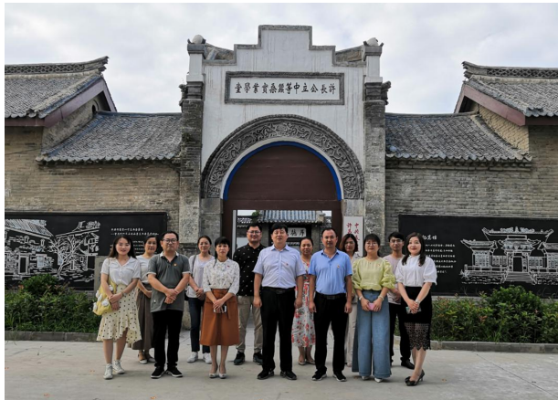
红色教育基地参观学习

作常态化。2020年，全市开展美丽乡村创建推进会5次、月互评6次、现场观摩3次，打造省级“千万工程”示范村15个。6月份，大周镇通过省级“美丽小镇”验收，入选河南首批50个省级美丽小镇。11月份，大周镇、后河镇闫楼村荣获第六届全国文明镇、文明村。二是制定并下发《长葛市2020年改善农村人居环境建设美丽乡村创建工作方案》（长农指办〔2020〕1号文）、《长葛市农村人居环境整治三年行动考核验收办法》（长农指办〔2020〕5号文）等文件，并积极组织开展疫情防控期间农村人居环境卫生专项督导、“大干50天，干干净净迎小康”冬季战役等全域村庄清洁行动。累计下乡督导村庄1200余次，编发工作简报61期。三是深入开展重点领域专项调研，联合相关部门对主次干道、背街小巷、积存垃圾、坑塘沟渠、柴草杂物、乱堆乱放和卫生死角等等影响村容村貌的重点问题进行专项调研5次，全力打好改善农村人居环境建设美丽乡村三年行动收官战。9月份，《河南长葛把改善人居环境作为最大民生》《河南长葛市：推进美丽乡村建设》《长葛市绘出乡村振兴醉美画卷》《河南长葛：整治环境让美丽乡村韵味深长》等展示长葛市改善农村人居环境美丽乡村创建成果的文章相继在学习强国平台、农民日报、人民网、