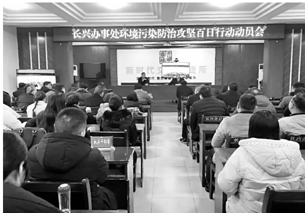
长兴办事处环境污染防治攻坚百日行动动员会

【环保工作】 一是多措并举，强化治理。强化大气污染防治，对辖区6家散乱污企业拆除作业设备实施彻底整顿；严查辖区散煤燃烧情况，共收缴散煤15000余块，对已经取缔的散煤销售点，不定期进行回头看，防止死灰复燃；严格落实禁止销售、燃放烟花爆竹要求；强化各类扬尘污染防治，对4处建筑工地裸露地面、土堆实施密网覆盖，加大道路洒水降尘频次力度；开展餐饮油烟治理，督促辖区餐饮经营户按照要求安装油烟净化装置；坚持“白+黑”“5+2”工作机制，做好环保日夜巡查工作，建立每日台账，对照问题清单，有效整改。二是加强宣传，营造氛围。大力宣传环保，增强企业从业人员依法生产和经营的自觉性，营造出保护环境全民参与的浓厚氛围，让辖区群众更深入地、全面地了解环保法律、法规、环境质量的状况、环境保护工作的重要性，增强环保工作的紧迫感和责任感。累计悬挂环保宣传横幅700余条，发放宣传彩页10000余份。