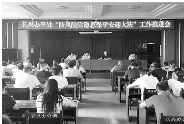
“防风险除隐患保平安迎大庆”工作推进会

四是提高计生服务水平。在大力推进人口计生服务水平能力建设的同时，更在落实惠民计生政策上下功夫，充分体现对计生家庭的普惠优先。全年发放奖扶资金 620 人。（其中：特扶 3 人，奖扶 146 人，扩扶 330 人，城镇奖扶 54 人，领取独生子女费 87 人），独生子女、双女办理中招加分 12 人，60 岁住院医疗保险 101 人，合作医疗 238 人，免费孕前优生 112 对，办理一孩服务证 96 对，二孩服务证 102 对。