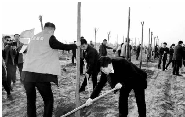
新107国道廊道林荫化

及城市森林体系建设，积极推进森林进城、森林环城，打造城市融入森林的生态园林格发展中心。城市生态圈冬春规划区域覆盖增福、和尚桥、老城、长社、长兴、建设、金桥7个镇(街道)，绿化面积4600亩，完成4633亩，占任务100.7%。二是廊道林荫化。廊道绿化是2019年长葛市国土绿化工作的重心，规划廊道绿化总里程258.6公里，绿化面积26954亩(含补植完善)，突出打造新107国道、郑许快速通道、京港澳高速、郑尧高速、燕振昌大道等重点廊道，其他域内各级道路、河流全覆盖，打造贯通郑许、互联互通的全域绿廊体系。完成29330亩，占任务108.8%。三是乡村林果化、庭院花园化。1.围绕全市146个村庄，重点是36个“美丽乡村”示范村实施“果树进村”工程，平均每人1株果树，重点放在房前屋后、农户庭院、空宅荒园等地方，着力形成瓜果飘香的乡村绿化格发展中心，任务2000亩，完成2310亩，占任务115.5%。2.在村庄出入口道路、村委会、游园广场等地增加乔木，充分利用村庄的荒地、边角等“见缝插绿”营建片林，任务1000亩，完成1051亩，占任务105.1%。四是平原林网化。以高大防护效果好的乡土树种为主，重点对路面完好的乡道、村道进行绿化，消灭空白路段，实现无空档无死角，达到有路有树，任务1000亩，完成1080亩，占任务108%。五是山区森林化。对后河镇陞山容易造成水土流失的浅山丘岗地，特别是25度以上的坡耕地进行绿化，逐步恢复森林植被，增加森林面积，绿化面积330亩，完成330亩，占任务100%。