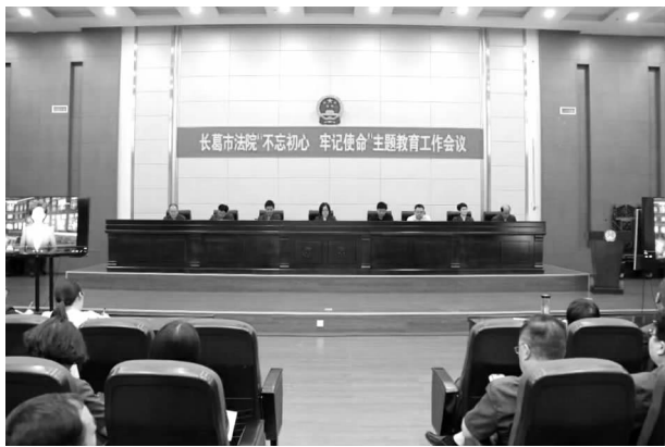
召开“不忘初心、牢记使命”主题教育工作会

【党建工作】 2019年,市中级人民法院扎实开展“不忘初心、牢记使命”主题教育,组织党员干部深入学习习近平新时代中国特色社会主义思想,读原著、学原文、悟原理,进一步坚定理想信念。丰富创新学习形式,组织参观中央河南调查组旧址,接受红色洗礼。各支部依托微党课,深入开展向时代楷模燕振昌、全国模范法官李庆军等先进典型学习教育,筑牢初心使命,提升司法为民服务能力。发挥党建龙头作用,落实党建主体责任,全面提升“三会一课”制度建设,从严召开民主生活会,严肃党内政治生活。深刻检视法院工作中的突出问题,认真解决群众反映强烈的涉诉信访、执行难等问题,切实实现“守初心、担使命、找差距、抓落实”目标。