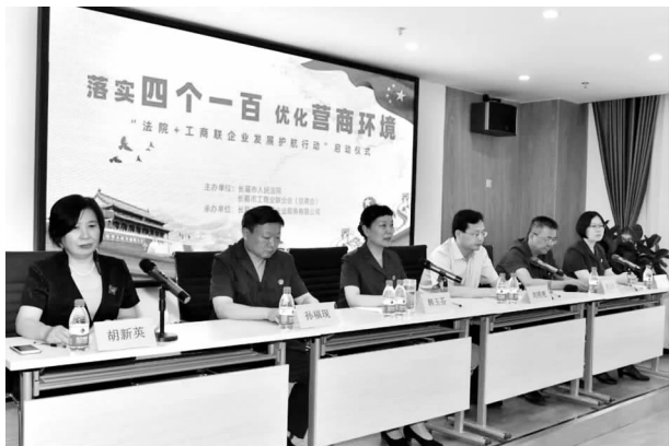
“法院+工商联企业发展护航行动”启动仪式

【优化营商环境】 2019 年，市法院贯彻新发展理念，开辟民营企业涉诉纠纷“绿色通道”，启动“法院+工商联”企业发展护航行动，切实为民营企业提供立案、审判、执行、破产等“一站式、全流程”服务。办案中严格区分违约与违法、合法财产与违法所得的界限，严禁超标的、超范围查封冻结涉案财产，最大限度维护涉诉民营企业正常生产经营。全年审结涉民营企业案件 284 件，为企业追回欠款 1.5 亿元。一系列法治“组合拳”，有效提升全市民营经济发展加速度。