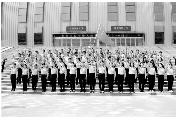
2019年12月4日，长葛市“守初心、担使命，千名公职人员宪法宣誓活动”

【律师、司法鉴定工作】 组织全市律师、公证、司法鉴定行业开展践行“三个十”文明服务规范活动。深化“律师进社区”，推进村（居）法律顾问工作，积极组织59名律师担任全市230个行政村（居）法律顾问，建立49个微信工作群，实现村（居）法律顾问全覆盖。深化民营企业公益“法治体检”工作，帮助企业分析法律需求和风险点，查找制度漏洞和薄弱环节，全年长葛市5家律师事务所相关律师各自走访顾问单位及相关企业。开展司法鉴定监督检查工作，严肃查处违法违纪行为，不断提升司法鉴定质量。在长葛电视台、《今日长葛》开辟律师说法、律师以案说法栏目，每月1~2期，全年进行了7期。共组织6次“送法进校园”活动，组织全市20余家普法宣传责任单位联合到4个街道8个社区，进行了为期4天的大规模宣传活动，共发放宣传资料5万余份，受教育群众10万余人。