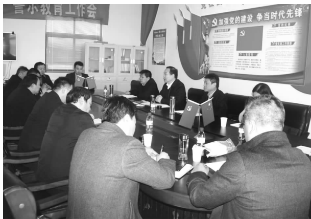
许昌市副市长楚雷到长葛市调研乡村振兴示范区实施情况

【乡村振兴战略】 坚持规划引领，围绕“1513”城镇布局和乡村振兴“1+1+N+1”政策体系，制定印发乡村振兴实施意见，全程参与乡村振兴战略规划编制，配套出台人居环境整治行动方案。将改善农村人居环境作为实施乡村振兴战略的第一场硬仗，大力实施“六改一增”工程，完成户厕改造3万余户，整村推进134个村庄，建成村级标准公厕104个；坚持周观摩、月排名制度，探索实行“五分钱工程”，充分调动广大群众改善村容村貌的积极性，全市集中打造1个乡村振兴示范镇，7个乡村振兴示范村，14个“千万工程”示范村，36个标兵村，108个示范村，246个提升村，农村人居环境整治持续走在许昌前列，长葛市被确定为全省乡村振兴示范县（市）。11月份迎接了省委农办2019年中央和省委一号文件贯彻落实情况督查调研。