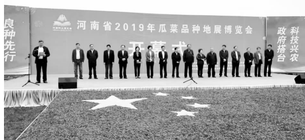
河南省2019年瓜菜品种地展博览会开幕式 在长葛市石象镇种业小镇举行

镇入选“全国农业产业强镇示范建设名单”。全年，全市小麦育种面积达到6万亩，蔬菜育种面积达到2.5万亩。新型农业经营体系进一步完善，许昌市级以上农业龙头企业32家，新增农民专业合作社18家，总数达到539家；新增种粮大户51家，总数达到211家；新增家庭农场20家，总数达到141家。其中：评定国家、省、市、县级示范社52个，省、市、县级示范家庭农场24个。一二三产业融合发展，全市都市生态农业企业达到35家，实施鼎诺蔬菜种子工厂化培育及电商营销、长葛市神龙家庭农场产业融合提升建设、中万电商农产品展示厅、3000吨饲料原料仓储库建设四个标段产业融合项目，中国蜂业博览会暨2019年全国蜂产品市场信息交流会在长葛市成功召开，长葛市被列入全国农村一二三产业融合发展先导区创建单位。农产品质量安全监管能力稳步提升，全市建成省级、市级农产品质量安全追溯点9个，全市“三品一标”生产基地18家，其中无公害农产品产地16家（含无公害淡水鱼生产基地），无公害农产品22个，绿色食品3个，总生产面积达到5.1万亩，正在积极创建全省农产品质量安全县。农村电子商务进一步完善，全市建成269个益农信息社，被阿里巴巴誉为“岗李现象”的岗李、尚庄、双庙李、和尚杨等村已发展成为“大众创业、万众创新”的先进典型。