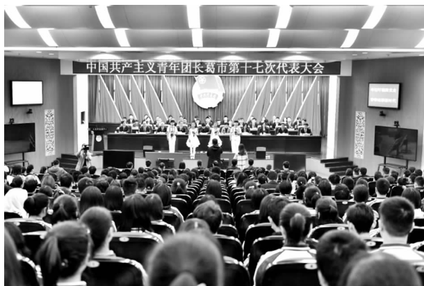
共青团长葛市第十七次代表大会

葛市第十七次代表大会在新区会展中心隆重开幕。来自全市各行各业、各条战线的 187 名团代表肩负着全市团员青年的重托，欢聚一堂，共商全市青年工作发展大计，市委尹书记向全市广大团员青年提出殷切希望，大会选举出 1 名书记、2 名副书记、1 名兼职副书记、1 名挂职副书记。