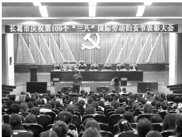
长葛市召开庆祝第109个“三八”国际劳动妇女节表彰大会

【思想引领】 一是召开庆祝第109个“三八”国际劳动妇女节表彰大会，对“三八”红旗集体、“三八”红旗手、妇女工作先进单位、妇女工作先进个人、最美创业女性、最美家庭、最美乡村女干部、巾帼文明岗、维护妇女儿童权益先进集体进行了表彰和奖励。二是开展“巾帼心向党、礼赞新中国”主题宣传教育活动，通过大合唱、舞蹈、旗袍秀、情景剧等丰富多彩的形式吸引妇女群众参与进来，营造了共庆祖国华诞、共享祖国荣光、共铸中国梦的热烈氛围。