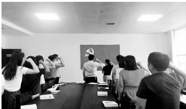
农改办全体党员重温入党誓词

【宣传教育】 一是做到主要领导亲自抓,分管领导具体抓。二是时常对职工进行宣传教育,采用单位宣传栏,政治理论学习,单位集中学习、“学习强国”平台自学、党支部书记讲党课等形式广泛开展宣传工作。三是开展全支部党员干部集中学习十九大、十九届三中、四中全会精神和习近平总书记系列重要讲话精神十余次。组织全体党员观看“不忘初心,牢记使命”主题《中国机长》观影活动,组织全体党员参观燕振昌纪念馆2次、组织参观仲勋旧址1次。认真落实信息报送工作,全年