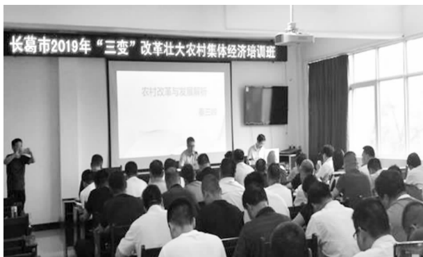
举办2019年“三变”改革壮大农村集体经济培训班

【三变改革】 按照市委、市政府要求,已按省定时间节点完成全市16个镇(街道)、364个村(居)、2619个村民小组共2999个农村集体经济组织产权制度改革工作,农村集体资产清产核资工作已通过省、市级验收,364个行政村(居委会)股份经济合作社已经挂牌并全部完成赋码登记。农改办通过聘请专家授课、组织试点村支部书记集中培训,各行政村立足村情,按照因地制宜原则,“能设则设、宜设则设”的原则,有16个镇(街道)37个村已经挂牌成立对应的公司或合作社。其中后河镇闫楼村已在农商银行开户,和尚桥镇于井村、金桥湾张村、建设桥南村、老城镇陈尧村利用城中村、城镇近郊村优势,探索设立劳务、置业、资产等合作社;石象镇尚官曹村、南席镇古城村、石固镇老岗李村等纯农业村探索设立土地、劳务合作社,与全市推行的以石象镇鼎诺合作社为龙头的