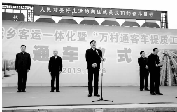
“万村通客车”提质工程通车仪式

乡公交客运班线已开通12条,拥有运营车辆116台;镇村公交班线16条,(其中14台为纯电动新能源车辆、另有8座小型客车和19座客车),共计车辆36台,投入的公交班线全域覆盖364个建制村。2019年10月26日上午,全市城乡客运一体化暨万村通客车提质工程通车仪式在市科技文化广场举行,市直相关单位、各镇(街道)及客运公司相关人员共计600余人参加了启动仪式。