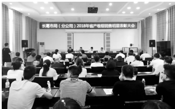
召开省产烟销售明星表彰大会

【卷烟营销】 优化品牌培育调状态。按照“抓一促二优三调四”的经营思路,丰富改进培育措施,发挥高端品牌引领作用,突出中端品牌支撑作用,稳定低端品牌基础地位,推动销售结构优化升级。推进省产烟转型升级调状态。全年销售省产烟18297.9箱,总量占比68.3%。紧盯黄金叶(帝豪)销售情况,全年销售11952.8箱,总量占比44.6%,与上年同期持平。密切客我关系调状态。扎实开展自律互助小组建设,定期组织召开小组季度例会、小组长培训会和内训师宣讲会,从真烟外流、串码销售和价格自律等方面加强对违规违约户的的日常监督和政策宣传,建立褒扬诚信、惩戒失信的激励和约束机制,增进了小组守约共识,共建了良好的客我关系。加强终端建设调状态。积极开展现代终端示范店建设维护工作,强化终端产品销售、形象展示、宣传促销、品牌培育、信息采集和消费跟踪等功能,现代终端引领作用进一步发挥。