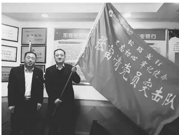
成立“张富清党员突击队”

员工，凝心聚力。认真落实市分行党委《基层网点员工关爱工程》，着力解决基层员工最关心、最需要、最迫切的问题。定期组织开展普惠、分期、技能等业务培训。开展青年员工提技能、做贡献活动，鼓励青年员工挑大梁，比贡献，晒业绩。为员工健身房购置了一大批跑步机、单车等运动器材。改善员工居住环境，在“三八”、端午传统节日期间，支部为全行员工送上慰问品和节日小礼物。放飞心情，缓解压力，组织员工开展爬山、采摘活动，凝聚全员团结合作、昂扬向上的精神面貌。落实党内关怀帮扶机制，定期对生活困难党员、员工开展慰问，对生活困难员工实施救助，切实帮助生活困难员工共渡难关。