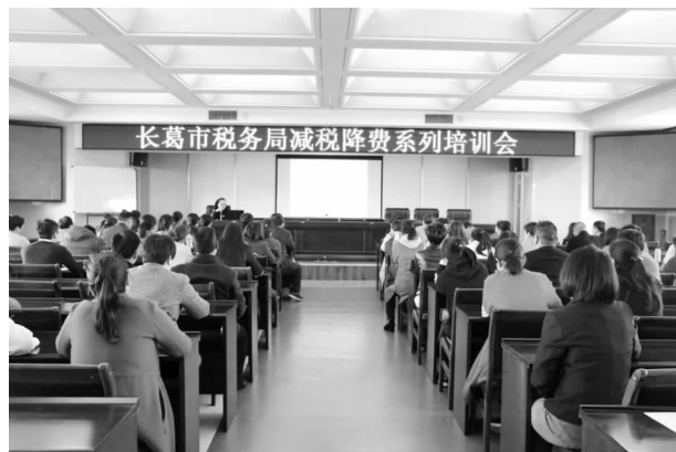
长葛市税务局减税降费系列培训会

【减税降费】 始终站在讲政治的高度落实减税降费，在政策宣传、退税办理、效应分析、责任落地、问题整改等方面持续发力，累计组织税务干部